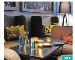
Seaside Residenz Hotel Chemnitz ★★★★★

Im Zentrum von Altenburg befindet sich das Hotel am Rossplan – ein idealer Ausgangspunkt für Sehenswürdigkeiten und Ausflüge. Stilvoll eingerichtet, bieten die hellen Zimmer modernen Komfort und sind mit Kühlschrank und kostenlosem WLAN ausgestattet. In den hauseigenen Restaurants, dem Hotelrestaurant und urigem Riebeckbräustübel, werden Sie mit Thüringer Spezialitäten und einem köstlichen Frühstück verwöhnt. Rofplan 8 04600 Altenburg www.hotel-rossplan.com