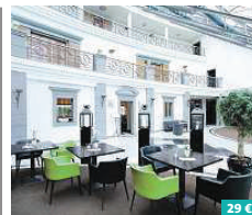
Lindner Hotel Leipzig ★★★★★

Das Parkhotel Meißen bietet 4-Sterne-Superior-Komfort und einen malerischen Blick über die Elbe, die Albrechtsburg und den Dom zu Meißen. Den Mittelpunkt des Hotelensembles bildet eine im Jahr 1870 erbaute Jugendstilvilla. Insgesamt stehen den Gästen 118 Zimmer und Suiten zur Verfügung. Weiterhin sechs Tagungsräume, ein Restaurant, eine Bar und ein exklusiver Spa-Bereich. Zusatzangebot: Spa-Bereich sowie 2- oder 3-Gang-Menü. Hafenstraße 27-31 01662 Meißen www.dorint.com/meissen