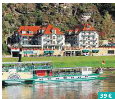
Hotel Elbschlösschen ★★★★★

Dresdens höchstes Hotel erwartet Sie in bester Citylage, direkt an der Prager Straße. Kostenfreies High Speed Internet, 319 Zimmer mit Rainshower und bodentiefen Panoramafenstern, das Restaurant „Le Boulevard“, die „Schwenkes“ Bar sowie die Relaxing Area „Ginkgo“ bieten alles, was Gäste von einem First-Class-Hotel erwarten. Erleben Sie stilvolle Wohlfühl-Atmosphäre! Zusatzangebot: Pullman-Burger inklusive eines Glühweins. Prager Straße 2c 01069 Dresden www.pullman-hotel-dresden.de