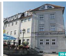
Hotel am Rossplan Altenburg ★★★★★

Das pentahotel Leipzig begrüßt Sie zu einem Aufenthalt der besonderen Art in einer lockeren Atmosphäre mit individuellem Service. Genießen Sie in den geräumigen Zimmern kostenfreies Mineralwasser, Wi-Fi und Pay-TV. Nach einem Spaziergang durch die Innenstadt können Sie den Tag in der offenen penta-Lounge mit Restaurant, Billardtisch und 24-Stunden-Barservice sowie im Pool-, Sauna- und Fitnessbereich ausklingen lassen. Großer Brockhaus 3 04103 Leipzig www.pentahotels.com/de