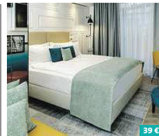
Hotel Indigo Dresden – Wettiner Platz ★★★★★

Das 4-Sterne Dorint Hotel befindet sich in der Stadtmitte, nur wenige Gehminuten von den historischen Sehenswürdigkeiten der Altstadt entfernt. Hier erwarten Sie 243 komfortable Hotelzimmer, alle ausgestattet mit Bad und WC, Föhn, Schreibtisch, Telefon, Kabel-TV sowie WLAN. Kulinarisch werden die Gäste im Restaurant „Die Brücke“ mit Dinner-Bufferets oder im „Alt Dresden“ mit köstlichen Speisen à la Carte verwöhnt. Grünauer Straße 14 01069 Dresden www.hotel-dresden.dorint.com