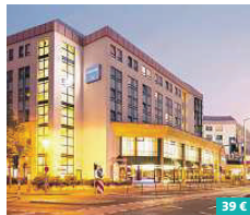
Dorint Hotel Dresden ★★★★★

Treten Sie ein in ein Refugium der Gastlichkeit, Ruhe und familiären Geborgenheit! Mitten im Neustädter Barockviertel gelegen und umgeben von inhabergeführten Geschäften, grünen Innenhöfen und Galerien, strahlt das romantische Hotel „Barock“ aus jeder Pore. Das Hotel verfügt über 28 elegante Zimmer und Suiten mit einem gelungenen Mix aus „Alt und Neu“. Freuen Sie sich auch auf das reichhaltige Frühstück, das keine Wünsche offen lässt. Rähnitzgasse 19 01097 Dresden www.buelow-residenz.de