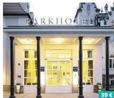
Dorint Parkhotel Meißen ★★★★★

Eingebettet in die einzigartige Landschaft des Nationalparks Sächsische Schweiz, direkt am Ufer der Elbe und am Fuße der Bastei liegt das Hotel Elbschlösschen. Zu diesem einzigartigen Umfeld gesellt sich ein ganzheitliches Wellnesserlebnis zum Wohlfühlen, das für Sie im Preis inklusive ist. Genießen Sie auch die frischen Küchenkreationen aus dem Restaurant mit Wintergarten, mit denen Sie Leib und Seele zugleich verwöhnen. Kottwitz 5 01824 Kurort Rathen www.hotel-elbschloessen.de