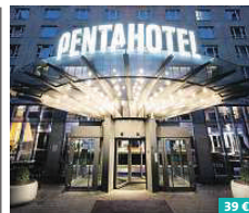
pentahotel Leipzig ★★★★★

Das Lindner Hotel Leipzig besticht durch seine zentrale Lage im ruhigen Villenviertel Leutzsch direkt am weitläufigen Auenwald. Spazieren Sie durch die naturnahe Umgebung – das sorgt für garantiertem Urlaubserlebnis. Freuen Sie sich weiterhin auf kostenfreien Sky-TV für Filme und Serien im Zimmer, Sky-Sport an der Bar sowie einem Shuttleservice in die Innenstadt. Im Restaurant „Am Wasserschloss“ kann der Tag kulinarisch abgeschlossen werden. Hans-Driesch-Straße 27 04179 Leipzig www.lindner.de/leipzig-hotel-leipzig