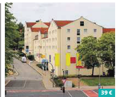
Hotel Astor Altenburg ★★★★★

Für einen unvergesslichen Aufenthalt bietet das 4-Sterne Mercure-Hotel Leipzig am Johannisplatz den perfekten Rahmen. Es erwarten Sie helle und freundliche Zimmer mit kostenlosem WiFi und weiteren Annehmlichkeiten. Ein Wellnessbereich mit Sauna und Whirlpool sorgt für zusätzliche Erholung und ist für Sie inklusive. Das Restaurant „LaLique“ bietet täglich internationale Gerichte. Zusatzangebot: 3-Gang-Menü Stephanstraße 6 04103 Leipzig www.acorhotels.com