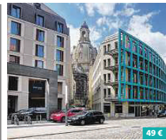
INNSIDE by Meliá Hotel Dresden ★★★★★

Verkehrsgünstig und zentral in der Dresdener Neustadt gelegen, empfängt Sie das moderne und stilvolle NH Hotel. Die komfortablen Zimmer sind vollklimatisiert und schallisoliert für erholsame Nächte. Zur Innenausstattung gehören bequeme King-Size-Betten, Minibar und kostenfreies WLAN. Das Hotel verfügt weiterhin über einen großzügigen Wellnessbereich mit Sauna und Dampfbad, Restaurant und Lobby-Bar. Hansastraße 43 01097 Dresden www.nh-hotels.de/hotel