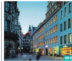
HYPERION Hotel Dresden ★★★★★

Das Holiday Inn Express Dresden City Centre bietet mit seiner zentralen Innenstadtlage in seinen 218 modern eingerichteten Zimmern den nötigen Komfort für einen Aufenthalt im Herzen von Dresden. Alle Zimmer sind Nichtraucherzimmer und bieten Annehmlichkeiten wie Kaffee-/Teestation oder kostenfreien Internetzugang. Starten Sie entspannt in den Tag beim Frühstücksbuffet und lassen Sie den Tag an der Hotelbar ausklingen. Dr.-Külz-Ring 15a 01067 Dresden www.ihg.com/holidayinnexpress