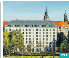
Holiday Inn Express Dresden City Centre ★★★★

Das INNSIDE Hotel Dresden verfügt über 180 modern eingerichtete Zimmer inklusive Minibar. Verschiedene Gastronomiebereiche – zum Beispiel die TWIST Bar mit Blick auf die Kuppel der Frauenkirche, ein Innenhof, vier Konferenzräume für maximal 230 Personen, WLAN-Zugang, ein Business Center in der Lobby sowie ein Fitness- & Wellness-Bereich mit Sauna, Dampfbad und vielem mehr runden den Service ab. Zusatzangebot: Wellness-Bereich Salzgasse 4 01067 Dresden www.melia.com