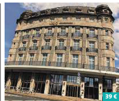
Victor's Residenz-Hotel Leipzig ★★★★★

Das InterCity Hotel Leipzig empfängt Sie in bester Lage direkt am Hauptbahnhof, von wo aus Sie beliebte Ausflugsziele wie den Leipziger Zoo oder das Gewandhaus bequem zu Fuß erreichen. In den komfortablen Zimmern können Sie dank kostenfreiem WLAN, Flatscreen-TV mit Sky Sport, Klimaanlage und Minibar so richtig entspannen. Frühstück und Abendbuffet erwarten Sie im hoteleigenen Restaurant und kühle Drinks an der Bar. Tröndlinring 2 04105 Leipzig www.intercityhotel.com/hotels