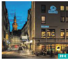
Hilton Dresden ★★★★★

Mit Blick auf die berühmte Frauenkirche und die Elbe liegt das Hilton Dresden ideal mitten in der historischen Altstadt und in unmittelbarer Nähe aller wichtigen Sehenswürdigkeiten. Die Gäste bekommen einen außergewöhnlichen Aufenthalt geboten, mit kulinarischen Genüssen in einem der 12 Restaurants und Bars. Die eleganten Zimmer verfügen über eine Mini-Bar, LED-TV, WLAN und Schreibtisch. Zusatzangebot: 3-Gang-Menü à la Chef An der Frauenkirche 5 01067 Dresden www.hiltonhotels.de