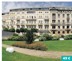
Hotel Elbresidenz an der Thermenbad Schandau ★★★★★

Das AMEDIA Hotel Dresden Elbpromenade, mit seinen 103 modern eingerichteten Zimmern, verwöhnt Sie mit individuellem Service und einem freundlichen Mitarbeiter-Team. Das Restaurant „Sandstein & Wein“ vereint Stil und Behaglichkeit in einem verführerischen Ambiente. Der Lichtdurchflutete Wintergarten lädt zur Erfrischung ein und die Lobby-Bar „BarRock“ zu internationalen Getränken. Zusatzangebote: Wellness-Bereich und 3-Gang-Abendmenü Hamburger Straße 64-68 01157 Dresden www.amediahotels.com/hotels/dresden