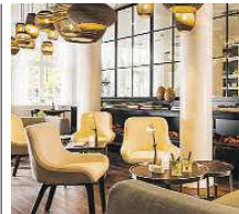
Holiday Inn Dresden – Am Zwinger ★★★★★

Ruhig – am Oberloschwitzer Elbhang in einem Villenort gelegen – empfangen wir Sie in unserem charmanten Haus mit einer über 160jährigen Geschichte und deren Tradition. Ob idyllische Terrasse mit einem reizvollen Blick über die Stadt, ein entspannendes Bad vor einem erholsamen Schlaf oder ein schickes Familienzimmer – unsere sechs reizvollen Zimmer bieten Ihnen Raum und Individualität für besondere Ansprüche. Kriegerstraße 1 01326 Dresden www.schoene-aussicht-dresden.de