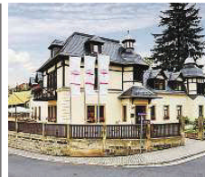
Restaurant und Hotel Schöne Aussicht ★★★★★

Die Bastei, zerklüftete Felsen, die Elbe, abwechslungsreiche Landschaft und reine Luft... das zeichnet die Sächsische Schweiz aus! An einem unvergleichlichen Platz, der all dies verbindet, liegt das Hotel Elbente. Hier können Sie in unberührter Natur die Akkus neu aufladen und sich im ElbenteSpa verwöhnen lassen. Unser Restaurant bietet regionale Küche mit frischen Produkten und dem schönsten Panoramablick über die Elbe. Wehlener Weg 1 01824 Kurort Rathen www.elbente.de