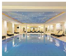
Maritim Hotel Dresden ★★★★★

Das Landhotel Dresden trägt seinen Namen zu Recht! Bis in die Dresdner City mit ihren bekannten Sehenswürdigkeiten sind es nur 7 Kilometer. Genießen Sie die Ruhe in den gemütlichen Hotelzimmern, im Restaurant oder in der Kaminsuite. Die Küche wird Ihren Gaumen mit Schmanekern aus Sachsen und Deutschland verwöhnen, aber auch andere Spezialitäten werden frisch gekocht und mit Liebe auf den Teller gebracht. Fritz-Meinhardt-Str. 105 01239 Dresden www.landhotel-dresden.de