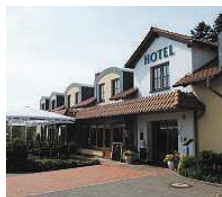
Landhotel Dresden ★★★★

Das Landhotel Dresden trägt seinen Namen zu Recht! Bis in die Dresdner City mit ihren bekannten Sehenswürdigkeiten sind es nur 7 Kilometer. Genießen Sie die Ruhe in den gemütlichen Hotelzimmern, im Restaurant oder in der Kaminsuite. Die Küche wird Ihren Gaumen mit Schmanekern aus Sachsen und Deutschland verwöhnen, aber auch andere Spezialitäten werden frisch gekocht und mit Liebe auf den Teller gebracht. Fritz-Meinhardt-Str. 105 01239 Dresden www.landhotel-dresden.de