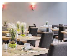
Park Inn by Radisson Dresden ★★★★★

Lernen Sie uns kennen! Im denkmalgeschützten, historischen Erlweinspeicher, direkt an der Elbe und neben dem Landtag gelegen, übernachten Sie in komfortablen Zimmern inklusive kostenfreiem WLAN. Am Morgen genießen Sie die riesige Auswahl unseres bekannten Frühstücksbuffets. Entspannen Sie während Ihres Aufenthalts im großen Pool mit Saunen und lassen Sie den Abend an der Bar ausklingen. Devinertstraße 10-12 01067 Dresden www.maritim.de