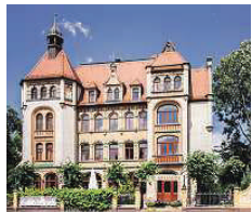
Hotel Artushof ★★★★★

Treten Sie ein in ein Refugium der Gastlichkeit, Ruhe und familiären Geborgenheit! Mitten im Neustädter Barockviertel gelegen und umgeben von inhabergeführten Geschäften, grünen Innenhöfen und Galerien, strahlt das romantische Hotel „Barock“ aus jeder Pore. Das Hotel verfügt heute über 28 elegante Zimmer & Suiten mit einem gelungenen Miteinander von „Alt und Neu“. Neben im Bülow Palais kann der Spa-Bereich mitbenutzt werden. Rähnitzgasse 19 01097 Dresden www.buelow-residenz.de