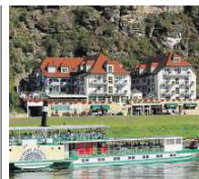
Hotel Elbschlösschen ★★★★★

Das HYPERION Hotel Dresden am Schloss überrascht seine Gäste mit einem modernen Innendesign hinter historisch anmutender Fassade. Die 235 zeitgemäß ausgestatteten Zimmer und Loft Suiten bestechen mit Eleganz und Komfort. Im Herzen der Dresdner Altstadt gelegen, mit weltberühmten Nachbarn wie der Frauenkirche und der Semperoper, bildet das Hotel den perfekten Ausgangspunkt, um die Stadt mit all ihren Facetten zu entdecken. Schlossstraße 16 01067 Dresden www.h-hotels.com