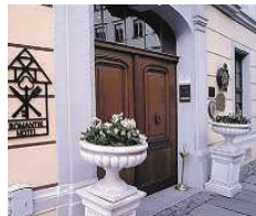
Romantik Hotel Bülow Residenz ★★★★★

Ringsum der einzige Felsen-Nationalpark Deutschlands. Von den Fenstern die Elbe. Exklusivität äußert sich hier neben der atemberaubenden Lage im entspannteren Ambiente, in den weitläufigen Verwöhnungsangeboten des Wellnessparks, beim zeitlosen Verweilen im Aurobad mit Saunalandschaft und Sonnenterrasse. Der Geist des Hauses atmet Kunst mit Gemälden von Dirk Sommer und Radierungen von Arthur Henne. Markt 1 – 11 01814 Bad Schandau www.elbresidenz-bad-schandau.net