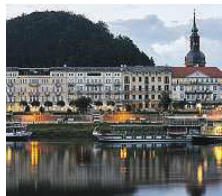
Hotel Elbresidenz an der Therme ★★★★★

Eingebettet in die einzigartige Landschaft des Nationalparks Sächsische Schweiz, direkt am Ufer der Elbe und am Fuße der Bastei liegt das Hotel Elbschlösschen. Bei diesem einzigartigen Umfeld fällt die Erholung leicht und die Natur lädt Sie ein, zur Ruhe zu kommen! Darüber hinaus erleben Sie bei uns ein ganzheitliches Wellnesserlebnis mit verschiedenen Beautyanwendungen und frischen Küchenkreationen. Kottwitz 5 01824 Kurort Rathen www.hotel-elbschloessen.de