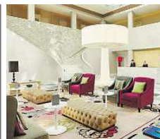
HYPERION Hotel Dresden ★★★★★

Das INNSIDE Hotel Dresden verfügt über 180 modern eingerichtete Zimmer ab 27 m 2 inklusive Minibar, verschiedene Gastronomiebereiche (VEN Restaurant, Lobby-Bar, TWIST Bar mit Blick auf die Kuppel der Frauenkirche), einen Innenhof, 4 Konferenzräumen auf der ersten Etage für max. 230 Personen, WLAN-Zugang, ein Business Center in der Lobby und einen Fitness & Wellness Bereich mit Dampfbad, Sauna sowie 2 Massage- und Kosmetikräumen. Salzgas 4 01067 Dresden www.melia.com