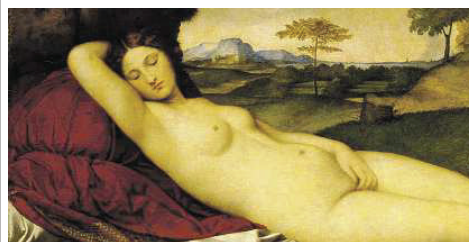
Giorgione, eigentlich Giorgio da Castelfranco Schlummernde Venus Um 1508–1510 © SKD, Gemäldegalerie Alte Meister Foto: Klaus www.skd.museum

Mit dem beigefügten Zwinger-Ticket können an den Wochenenden außerdem der Mathematisch-Physikalische Salon und die Porzellansammlung (Schließzeit: 29.1. bis 8.2.2018) besucht werden. Dazu einfach die Voucher an den Aktionswochenenden von Freitag bis Sonntag, an den Kassen der Galerie Alte Meister, Theaterplatz, einlösen (Öffnungszeiten 10 bis 18 Uhr).