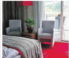
Hotel Elbente ★★★★★

Nur 2 km von der Frauenkirche entfernt im Stadtteil Dresden-Striesen befindet sich unser feines Stadtpalais. Beste Verkehrsanbindung, ausreichend Parkmöglichkeiten, hoteligene E-Tankstelle, kostenfreie Wifi, reichhaltiges Frühstück vom Vital-Buffer und besonders großzügige, familienfreundliche Zimmer und Suiten machen unser Haus zum perfekten Ausgangspunkt für Ausflüge in die historische Altstadt und das Umland der Kulturmetropole. Fischerstraße 30 01307 Dresden www.hotel-artushof.de