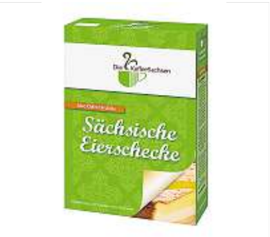
Der aus Dresden stammende Erich Kästner sagte einmal: „Die Eierschecke ist eine Kuchensorte, die zum Schaden der Menschheit auf dem Rest des Globus unbekannt geblieben ist.“ Die Dresden Information empfiehlt daher diese Backmischung als klassische Variante des Sonntagskuchens; für 4,90 Euro.