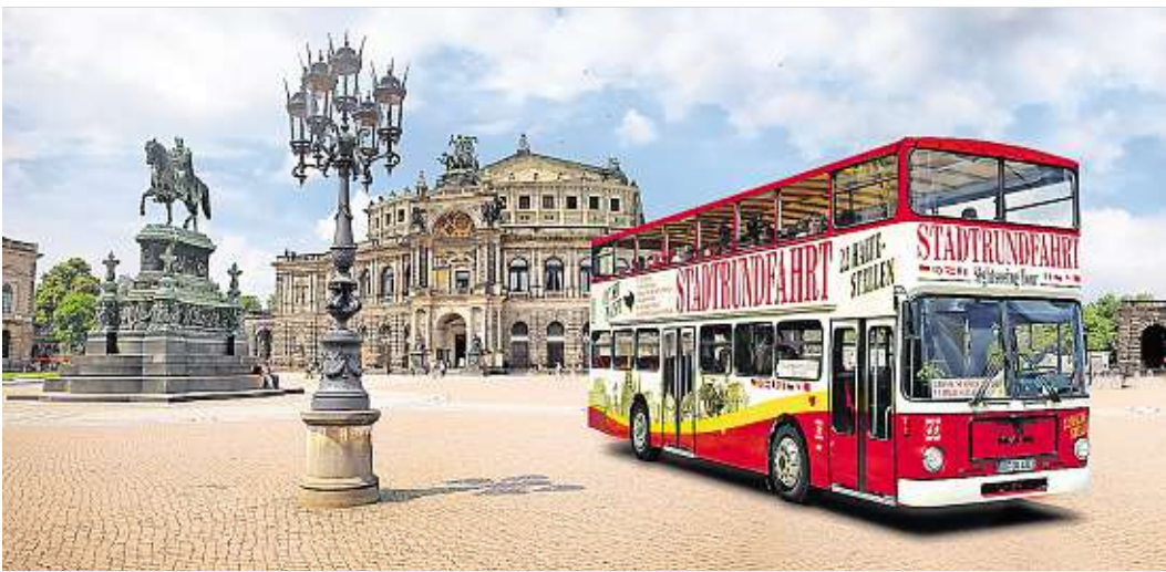
Die Doppelstockbusse der Stadtrundfahrt Dresden GmbH sind aus dem Stadtbild nicht mehr wegzudenken.

Die Angebote der Stadtrundfahrt Dresden GmbH verkaufen sich in der Dresden Information im QF besonders gut. Kund ist außerdem begeistert von den neuen Räumlichkeiten: „ Sie sind ausgesprochen modern und professionell gestaltet, mir gefällt vor allem die konsequente Nutzung der multimedialen Möglichkeiten. In meinen Augen sind sie ein super Aushängeschild für Dresden und ein großer Schritt nach vorn. Ich kenne deutschland- und weltweit viele Tourist-Informationen, doch etwas Vergleichbares ist mir noch nicht untergekommen. Und für uns besonders erfreulich ist auch, dass wir durch die neue Dresden Information deutlich mehr Geschäft erhalten als in den vorangegangenen Jahren. “