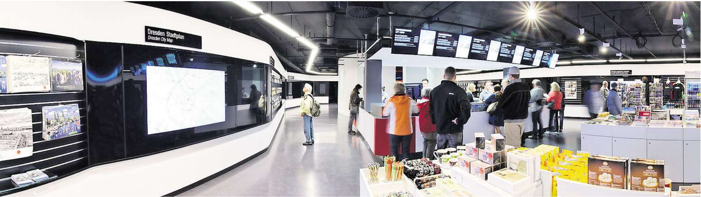
Dresdens Gäste werden großzügig empfangen. Im Untergeschoss des QF entstand für 300.000 Euro die neue Dresden Information.

Souvenirs mit Kultstatus und begehrte Sammlerobjekte