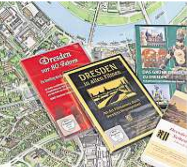
Filme zum alten und zum neuen Dresden. Auszüge der Filme laufen in dem kleinen Kino in der Dresden Information, die DVDs gibt es für 17,90 Euro auch hier zu kaufen.