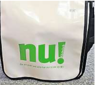
Nu! Die Dresden Information hat eine Auswahl an Taschen für echte Sachsen. Verschiedene Farben, 24,95 Euro