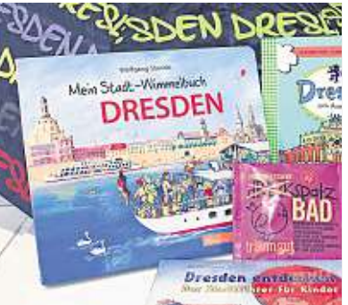
Ideen für kleine Dresden-Entdecker: Mal-, Wimmel- und Lesebücher, Kinderpflegeprodukte der Dresdner Essenz, Frauenkirchen-Fruchtgummis, Dresden-Memo und andere Spiele. Dreck-Spatz-Bad 1,79 Euro, Ausmalheft Dresden 2,95 Euro, Wimmelbuch Dresden 14,95 Euro, Dresden-Memo 9,90 Euro