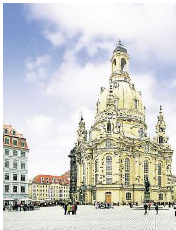
Wiedererstandenes Wahrzeichen von Dresden: die Frauenkirche am Neumarkt. Sie wird von einer Stiftung getragen.