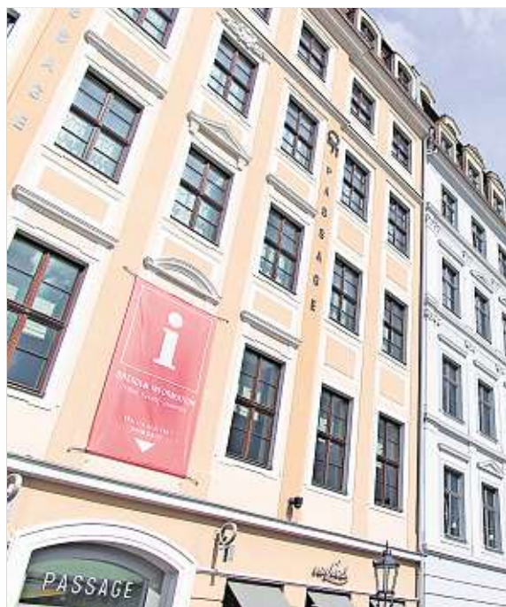
Schon von Weitem sehen die Besucher der Stadt, dass sie im QF die neue Tourist-Information finden.

Das Quartier an der Frauenkirche ist Treffpunkt und edle Shopping-Adresse für Einheimische und Besucher der Stadt.