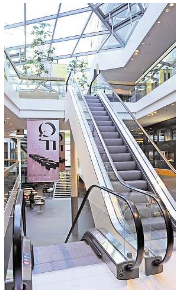
Blick in die Mall des Quartiers an der Frauenkirche: Hinter der wieder erstandenen barocken Fassade verbirgt sich moderne, edle Sachlichkeit.

Neben internationalen Labels, Kunst und Lifestyle steht das QF für Gaumenfreuden: Restaurants, Cafés und Bars laden zum Schlemmen und Genießen ein. Zur Auswahl stehen italienische Köstlichkeiten mit edlen Weinen und beste Pizza, asiatische Frische mit Sushi, heiße Suppen, aber auch ungewöhnliche Gerichte. Außerdem verführen handgemachte Pralinen, Eis, Kaffeespezialitäten oder prickelnder Prosecco. Es gibt also viele gute Gründe, das QF zu besuchen und von den