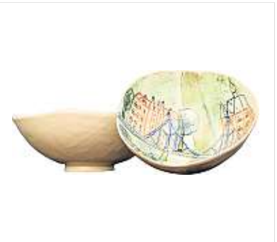
Handgemachte Schalen und Tassen mit Dresden-Motiven der Keramikerin Sonja Puppe, die mit der Fertigung derzeit kaum hinterherkommt – so schön sind ihre Unikate. Schale klein 26,90 Euro, groß 29,20 Euro, Tasse 29,90 Euro