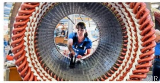
Eine Mitarbeiterin der 392533-Unternehmensgruppe arbeitet an Stator für Elektromotoren und Generatoren.