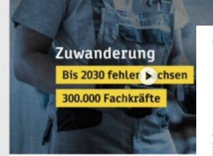
Zuwanderung Bis 2030 fehlen 300.000 Fachkräfte

Fast alle Teilnehmer der Runde sind sich einig: Sachsen hat ein Imageproblem. Dass Weltoffenheit und fremdenfeindliche Pegida-Märsche und Übergriffe auf Ausländer nur schwer zusammenpassen, berührt viele Lebensbereiche in dem Freistaat - auch und besonders die Wirtschaft. Was, wenn das Stigma des Rassismus, des