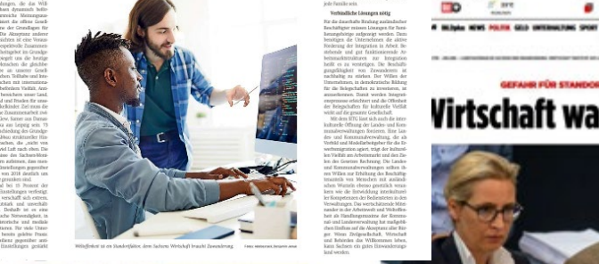
Wirtschaftler in der Industrieregion des freien Hochsitz Sachsens