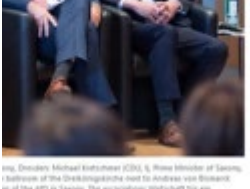
Die Spitzenkandidaten der Parteien in der Dresden Dreikönigskirche...