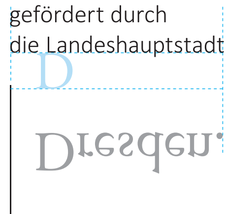
Logo Stadtverwaltung mit Textzusatz oben