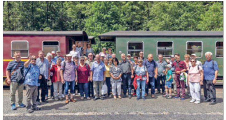
Familienfahrt mit der Schmalspurbahn Oybin-Zittau

Im August werden wir noch zwei Mal in der näheren Umgebung zu erleben sein. Am 18. August veranstalten unsere guten Freunde, die Grünberger Musikanten, ein Konzert im Hermsdorfer Park, zu dem wir mit einem heiter und schwungvoll gestimmten Programm beitragen wollen. Nur wenige Tage später, am 26. August, findet auf der Hofewiese wieder das seit einigen Jahren etablierte, große Chorfestival statt,