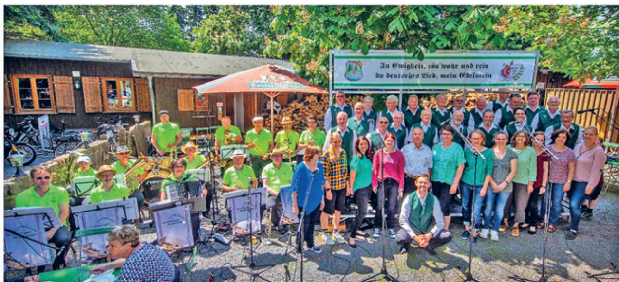
Foto vom diesjährigen Pfingstsingen in der Köhlerhütte Weixdorf

Ort: Schlosspark Hermsdorf auf der Steinbühne