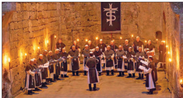
Der Weixdorfer Männerchor singt zum Mönchszug auf dem Oybin

Und auch die Vertreter des Vereins Mönchszüge Oybin kamen unmittelbar nach Ende des Programms zu uns, teilten uns ihre Begeisterung für unseren Chorklang und den ganzen Abend mit und luden uns sofort für einen Mönchszug auf dem Oybin in der Zukunft ein.