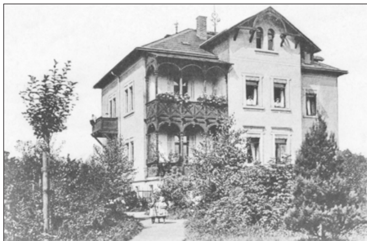
Die Villa von Albert Geucke, 1905

Im April 1904 ließ Albert Geucke am „Mittelweg“ seiner Spargelplantage Pflanzlöcher für Obstbäume ausheben. In einer Tiefe von rund einem Meter stießen die Arbeiter auf Tonscherben eines Urnenfeldes der jüngeren Bronzezeit (etwa 1.100 – 700 v. Chr.). Die Scherben können dem „Lausitzer Typus“ zugeordnet werden. Sie befanden sich in sogenannten „Herdgruben“, d. h. es wurden dabei keine Knochen gefunden. Die Bruchstücke lassen sich unterschiedlichen Gefäßen zuordnen, wobei die größeren Scherben auf eine kesselartige Form der Gefäße schließen lassen. Diese sind, neben der typischen Kettenleiste, mit einem Rad-Ornament verziert. Dieses Ornament ist in weiteren Fundorten der nächsten Umgebung (Klotzsche, Gomlitz, Lausa, Friedersdorf, Medingen usw.) nicht vorgefunden worden und stellt deshalb