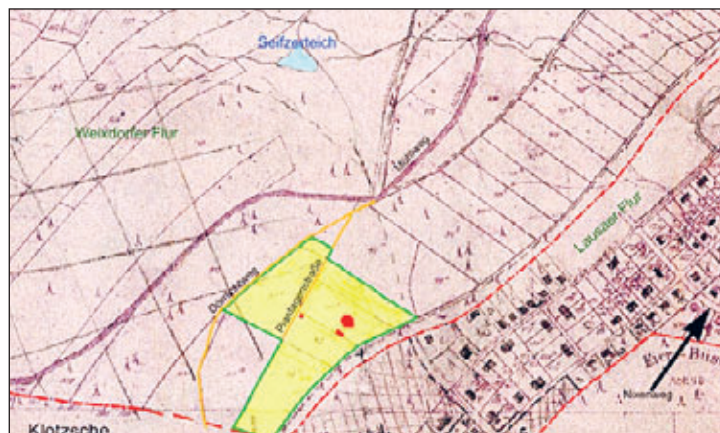
Lageplan (gelb) der Plantage

Die Plantage bestand auf Lausaer Gebiet im sogenannten „Heidehof“ an der Grenze zur Gemarkung Klotzsche. Diese Fläche gehörte vorher zur Dresdner Heide. Die genaue Lagebezeichnung: Flurbuch Lausa, Parzelle 97. Im Jahr 1898 kaufte Albert Geucke von dem Lausaer Bauern Ernst Julius Müller ein ca. 2,5 ha großes Landstück mit Feld und Kiefernhochwald. Auf dem Grundstück wollte er eine Gärtnerei mit Spargel und Obstanbau und dazu gehörig eine kleine Kelterei einrichten. Nach Vermessung und Erschließung des Geländes ließ er 1903 mehrere Gewächshäuser bauen.