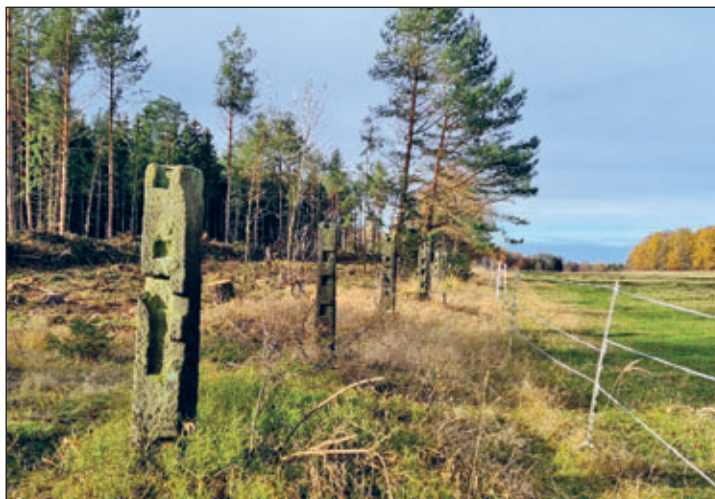
Südliche Grenze der Hofewiese mit historischen Zaunsäulen

Nun geht der Weg anfangs leicht und später steil bergab ins Prießnitztal. An der Kuhschwanzbrücke über die Prießnitz treffen wir auf die Alte7 und überqueren den Prießnitztalweg.