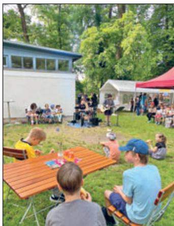
Sommercafé – außen

Es waren wieder vier schöne Café-Nachmittage im Juni mit toller Musik, wunderbaren, selbstgebackenen Kuchen und angenehmen Gesprächen bei bestem Wetter im Kirchengarten!