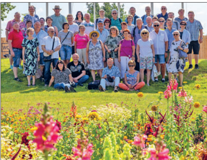
Weixdorfer Delegation mit Gemeinderäten aus Brühl