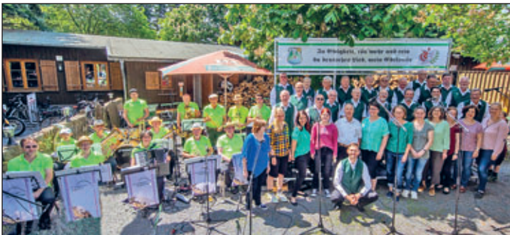
Alle teilnehmenden Musiker des Pfingstkonzerts

Das Konzert, welches durch den Bundesverband Chor und Orchester gefördert wurde, begann mit einer zünftigen Blasmusikeinlage der Grünberger, gefolgt von unserem ersten Liederblock, bei dem traditionelles Liedgut und Gesänge zum Bier im Mittelpunkt standen. Zwei dieser Lieder hatten wir von unseren Mitsängern aus Wilschdorf gelernt. Nach weiteren fröhlichen Klängen der Blasmusiker traten die Pop-Vocals zum ersten Mal öffentlich in Weixdorf auf. Ihr Programm, das Titel aus der Rock- und Gospelmusikszene umfasst, gab einen guten Kontrast im Repertoire des Konzerts. In unserem zweiten Programmblock stellten wir einige neu oder wieder einstudierte Lieder vor, die sich textlich und musikalisch teilweise von der traditionellen Männerchormusik unterscheiden. Großer Beifall war der Lohn für unsere Sänger.