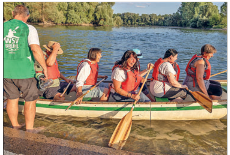
Ausfahrt auf dem Rhein