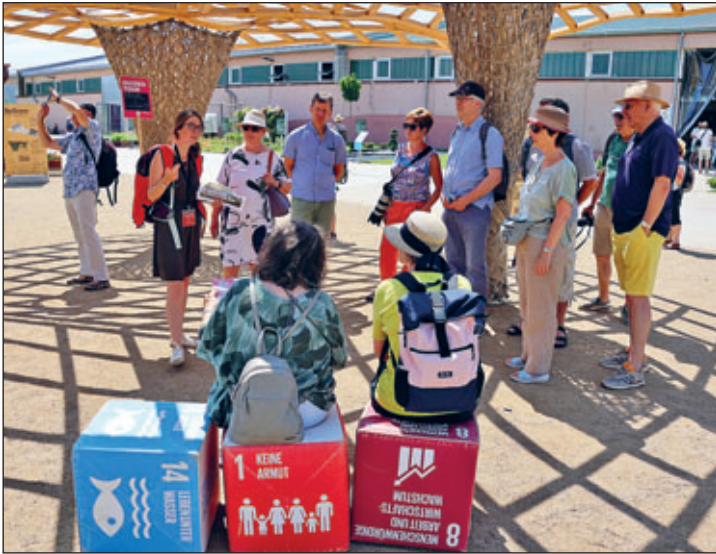
Besuch der BUGA Mannheim