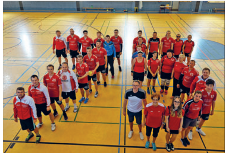
Die Handballerinnen und Handballer stellten anlässlich des Jubiläums eine 75 in der Gerhard-Grafe-Sporthalle.

Am 2. Jubiläumstag spielte die Handball-Jugend die Hauptrolle. Die E-Jugend begann das Spiel gegen Klotzsche. Konnte im Hinspiel sehr hoch gewinnen, brach dann im Rückspiel leider ein und musste sich geschlagen geben. Ein ähnliches Bild bot sich bei der D-Jugend. Auch hier verlor die neu geformte Mannschaft gegen die D-Jugend der SG Klotzsche. Die C- Jugend hatte sich die höherklassig spielenden Weinböhlaer Handballer eingeladen. Die Weixdorfer Jungs hielten gut mit, mussten aber auch den Sieg knapp abgeben. Die B- Jugend bestritt ihr letztes Spiel in dieser Konstellation gegen den TSV Radeburg. In dieser Mannschaft gibt es einige Talente, die in der nächsten Saison beim HC Elbflorenz trainieren werden. Die jungen Weixdorfer Männer setzten