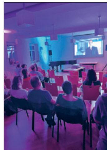
Sommerkino – innen