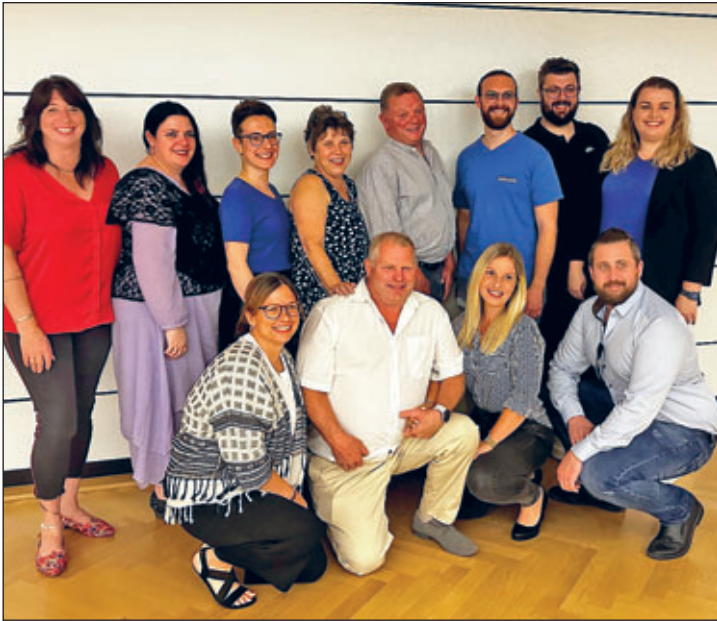
Treffen der Partner-Faschingsvereine Weixdorfer Karnevals-Club e.V. und Karnevalverein Kollerkröten Brühl e.V.