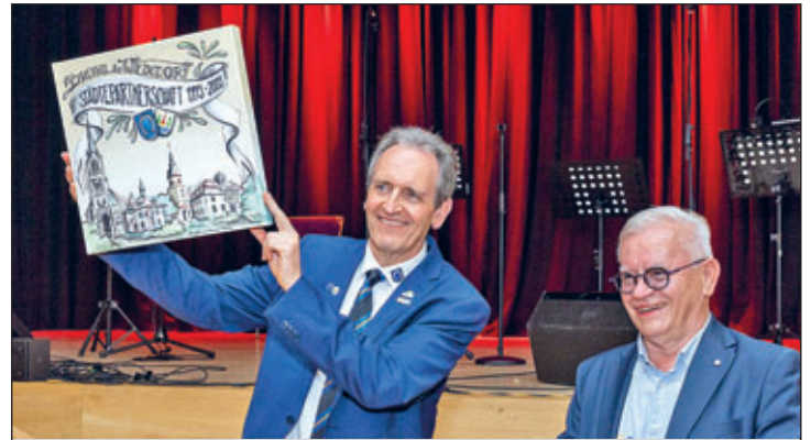
Festveranstaltung 30 Jahre Partnerschaft