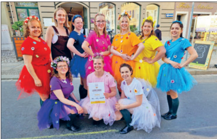
So sehen Sieger der Herzen aus.

Es hat allen viel Spaß gemacht und es war schön, nach so langer Auszeit mal wieder dabei zu sein. Wir freuen uns schon auf nächstes Jahr.