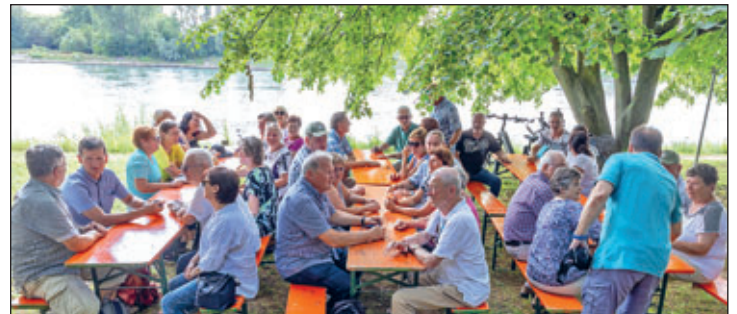
Sommerfest WSV Brühl