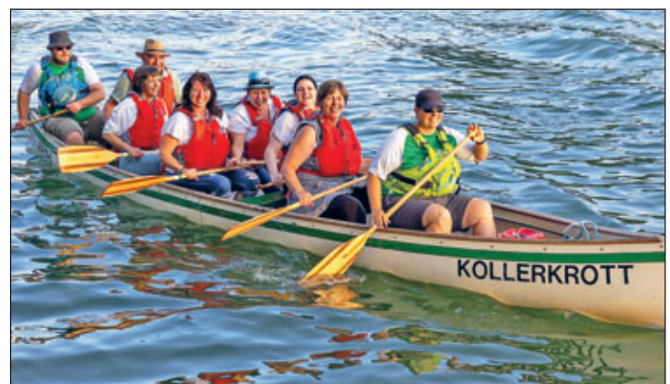
Text: Bärb'I und Steffi

Unser Dank gilt der Gastfreundschaft und Organisation, seid gewiss, wir freuen uns auf das nächste Treffen schon!