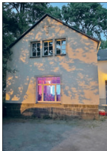
Sommerkino – außen