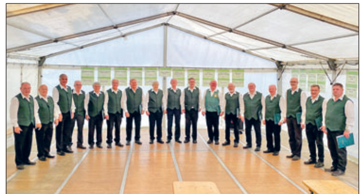
Auftritt im Festzelt Marsdorf

Wir möchten uns bei allen Sponsoren bedanken, die uns bei der Vorbereitung und Durchführung aller Auftritte und Veranstaltungen unterstützen, ohne deren Hilfe wir unsere Chor- und Vereinsprojekte nicht in angemessener Weise ausführen könnten.