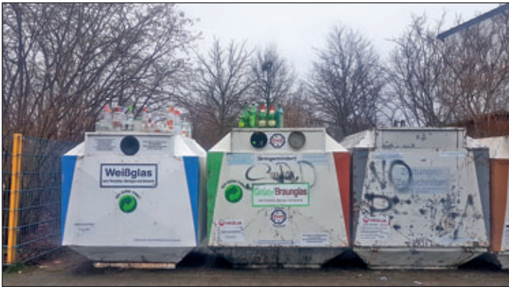
Wertstoffcontainerplatz – Am Zollhaus

Altglascontainer werden regelmäßig geleert. Doch kann es auch hier