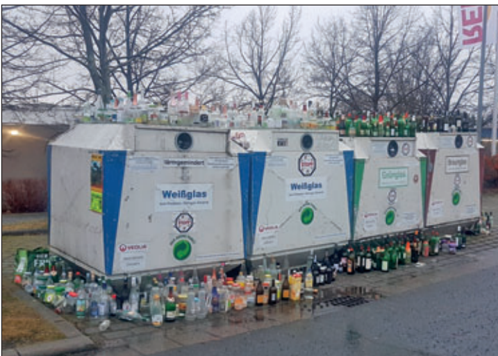
Wertstoffcontainerplatz – Parkplatz Kaufland

einmal passieren, dass die Entsorgungsfirmen mit der Entleerung Probleme haben.