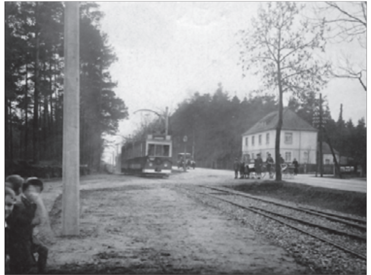
Ankunft der ersten Straßenbahn am 28. Nov. 1928 an der Haltestelle „Fuchsberg“.

Die Projektierung übernahm 1938 mit hoher Wahrscheinlichkeit Prof. Ernst Sagebiehl, Chefarchitekt im Reichsluftfahrtministerium, denn es wurden mit 5 verschiedenen Häusertypen geplant, die er für andere, bereits gebaute, Anlagen entworfen hatte. Die Blickachse bildete der Nixenweg dessen Abschluß praktisch ein großräumiges U-förmig angeordnetes Areal bildete. Mit den seitlich angrenzenden Häusern ergab sich ein Komplex mit 16 Wohneinheiten, wobei die freie Fläche als Festplatz für Veranstaltungen dienen sollte. Nordwestlich schloß sich die nächste Gebäudeeinheit mit 6 Wohnungen an, die eine separate Zufahrt über den Teil des Wiesenweges erhielt, der heute Ligusterweg