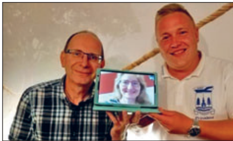
Der neue „alte“ Vorstand

Um nach den ganzen Zahlen rund um Einnahmen und Ausgaben die Aufmerksamkeit zu stärken und sich bei allen Mitgliedern für Ihr Engagement im vergangenen Jahr zu bedanken, ließ sich der Vorstand etwas ganz Besonderes einfallen. Jedes Mitglied erhielt eine