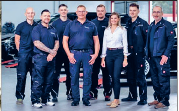
Das Personal der Stellmacherei Thalheim im Jahr 1920 und der Karosseriebaufirma Thalheim heute.