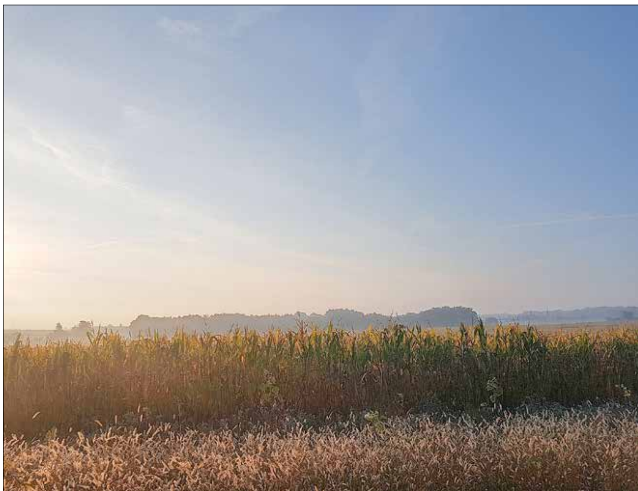
Blick nach Marsdorf