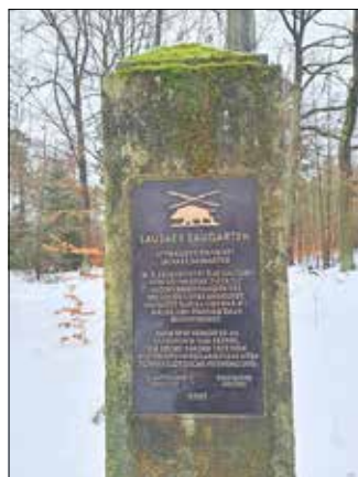
Gedenksäule für den ehemaligen Lausaer Saugarten am Hakenweg im südlichen Sauerbusch

Im 18. Jahrhundert entstand im nordöstlichsten Zipfel der Heide zwischen den Wanderwegen Kuhschwanz und Unterringel der etwa 1 Hektar große Liegauer Saugarten , früher Alter Saugarten genannt. Die Anlage wurde 1876 wieder beseitigt, heute erinnern nur noch ein Gedenkstein sowie einige niedrige Mauerreste an den Liegauer Saugarten. 1781/82 wurde der Langebrücker Saugarten als Neuer Saugarten errichtet. Er befindet sich südlich von Langebrück am Ochsenkopf und ist 1,27 Hektar groß. Nachdem 1868 und 1875 große Teile der Mauersteine abgetragen und für den Wiederaufbau des damaligen Dorfes Klotzsche nach einem Brand sowie der Dresdner Albrechtsschlösser genutzt wurden, ist der Langebrücker Saugarten 1992 bis 1994 im Auftrag des Sächsischen Forstamtes saniert worden. Dabei wurden die verfallenen Mauern und das in die westliche Mauer integrierte, sogenannte Wächterhaus erneuert. Außerdem finden sich zwei sogenannte Damentrittsteine, welche den Damen der Jagdgesellschaften als Steighilfe beim Aufsitzen dienten. Es ist die heute am besten erhaltene Anlage dieser Art. Ebenfalls im 18. Jahrhundert wurde im südlichen Teil des Sauerbusches zwischen Traubelweg und Alter Zehn der Lausaer Saugarten angelegt. Er umfasste ca. 0,42 Hektar und war ebenfalls mit Mauern und stabilem Zaun umfriedet. 1869 wurden auch hier alle Mauern abgetragen und für den Wiederaufbau des damaligen Dorfes Klotzsche eingesetzt. Es blieben keine baulichen Reste erhalten.