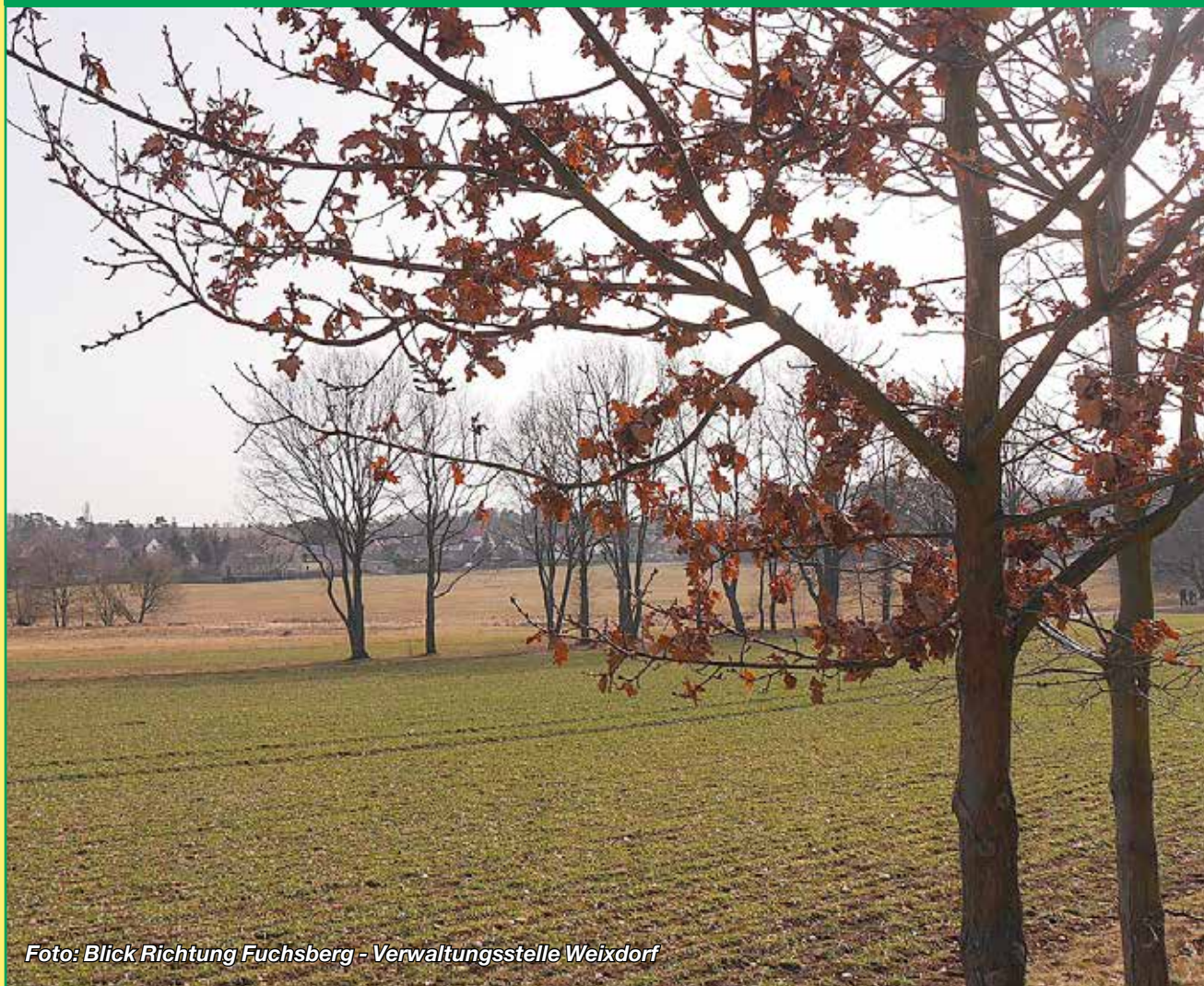
Foto: Blick Richtung Fuchsberg - Verwaltungsstelle Weixdorf