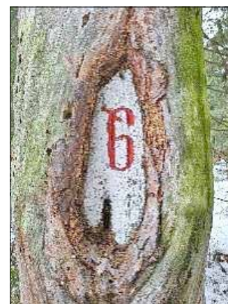
Halbmond und Kreuz6 südlich der Heidemühle