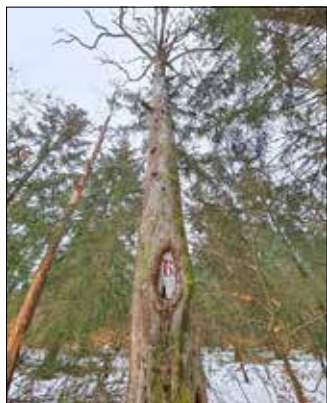
Geschnittenes Waldzeichen der Kreuz6 an einer mächtigen, abgestorbenen Kiefer südwestlich der Heidemühle

Die Pflege, Unterhaltung und ständige Erneuerung aller historischen Wegezeichen leisten Mitglieder des „Arbeitskreises Dresdner Heide“ im Landesverein sächsischer Heimatschutz dankenswerterweise in ehrenamtlicher Tätigkeit.