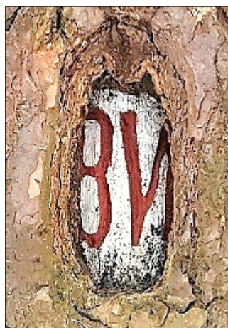
Blümpenweg südöstlich vom Schwarzen Kreuz unweit des Kannenhenkel im südwestlichen Heidegebiet