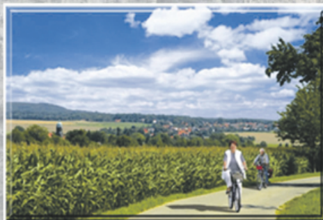
Blick auf Lohmen

Touristinformation Lohmen Schloß Lohmen 1 01847 Lohmen Tel 03501 / 5810-24 Fax 03501 / 5810-42 touristinformation@lohmen-sachsen.de www.lohmen-sachsen.de