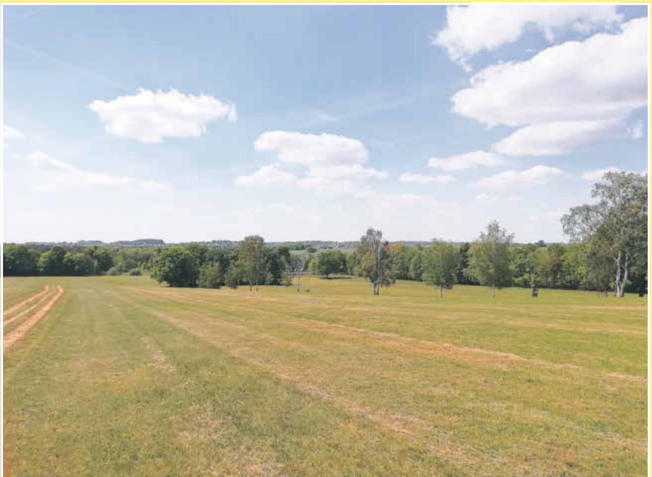
Blick nach Weixdorf