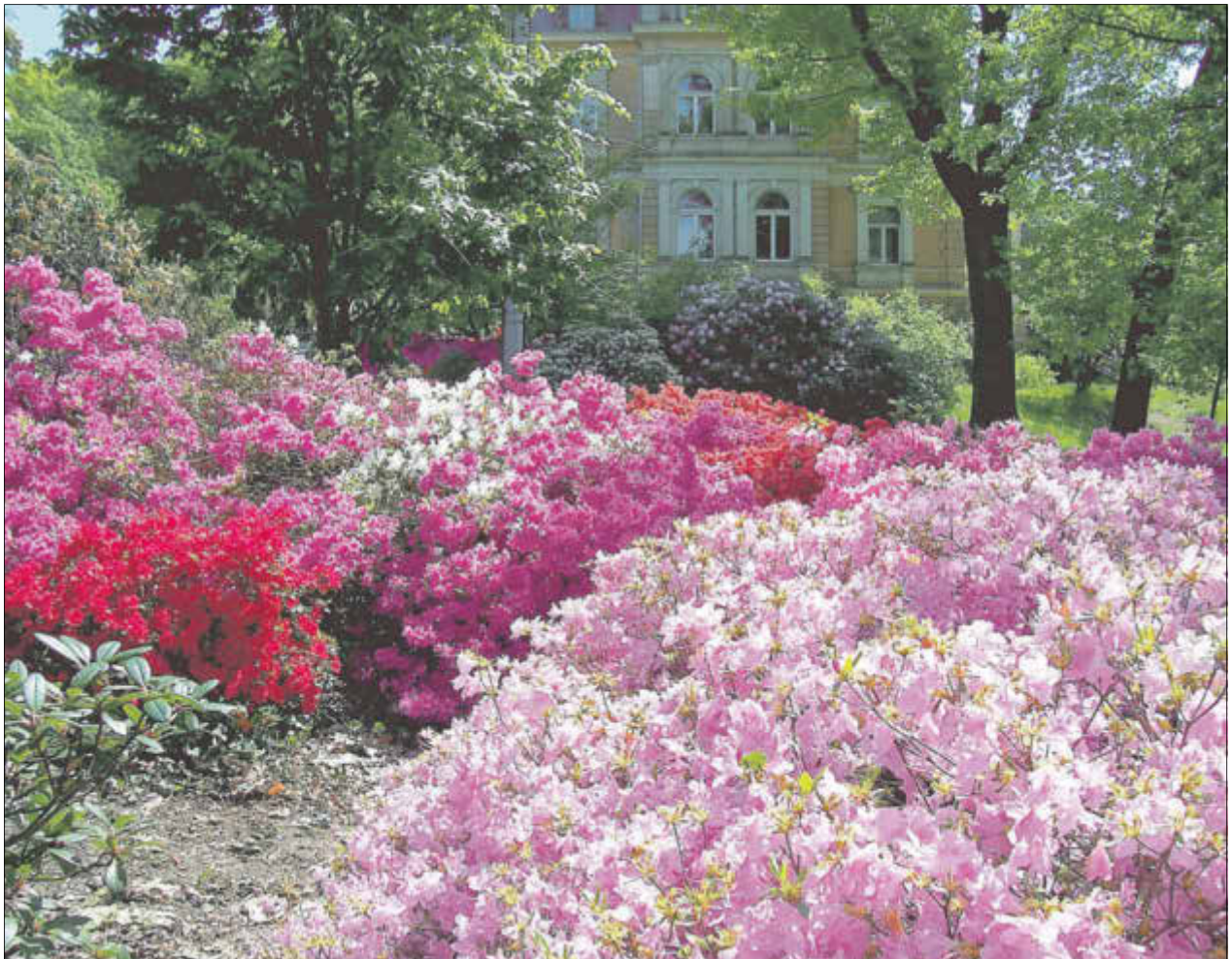
Wachwitzer Rhododendronpark