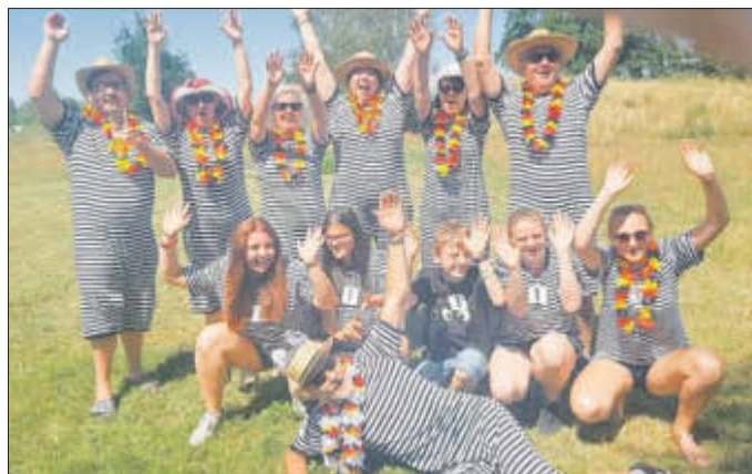
Hier unsere Truppe vom letzten Jahr.

Aufmerksame Leser der Weixdorfer Nachrichten kennen das Thema schon, da wir jedes Jahr davon berichten. Närrische Olympiade heißt, Sportliches (nicht ganz ernstgemeintes) Kräftenessen zwischen Karnevalsvereinen.