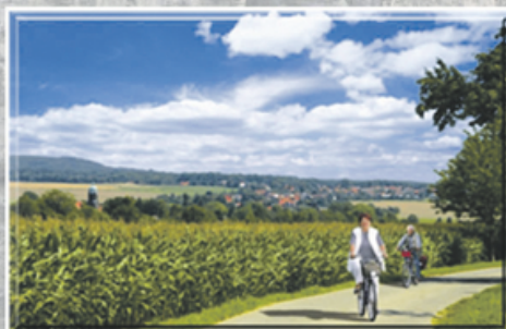
Blick auf Lohmen

Touristinformation Lohmen Schloß Lohmen 1 01847 Lohmen Tel 03501 / 5810-24 Fax 03501 / 5810-42 touristinformation@lohmen-sachsen.de www.lohmen-sachsen.de