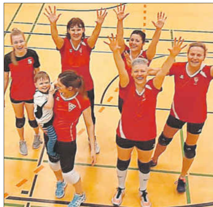
Die Damenauswahl der Weixvolleys

Im Anschluss an das anmutige, maskuline Kräfteressen wurde das Frauenvolleyballturnier ausgetragen. Die Zuschauerränge waren nun gut gefüllt und zwischen den 6 angetretenen Mannschaften entwickelten sich spannende Spiele voller Ballästhetik, sportlichem Ehrgeiz und Spielfreude. Gespielt wurde im Modus jeder gegen jeden und dabei wurde niemandem was geschenkt. Keine Mannschaft konnte sich klar im Teilnehmerfeld absetzen. Die Weixvolleys und die Auswahl des Radeberger SV teilten sich die Punkte ebenso wie der Langebrücker SV mit der Auswahl aus Erksdorf-Ullersdorf ... - es war verflucht ausgeglichen. Letztlich konnten sich die Damen der Weixvolleys knapp, aber hochverdient durchsetzen und mit einem Punkt Vorsprung vor den Zweitplatzierten aus Langebrück und den Drittplatzieren aus Radeberg endlich mal wieder den Turniersieg erringen. Glückwunsch! Unsere Jugendauswahl der Frauen hat sich auch dieses Jahr wieder wacker geschlagen – wenn es auch dieses Jahr noch nicht für einen Sieg gereicht hat, wird die Mannschaft mit hohem Potential in den nächsten Jahren für Furore sorgen. Es war ein toller, wieder einmal hervorragend organisierter Tag. Dank an alle Beteiligten.