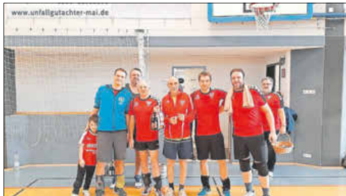
Weixvolleys 2. Mannschaft

Die 2. Mannschaft der Weixvolleys schaffte als Tabellenzweiter in ihrer Vorrundengruppe den Sprung in die Finalrunde um Platz 4. Gegen die Elche-Mix konnte man durch eine starke spielerische und kämpferische Leistung einen Satz für sich entscheiden. Im entscheidenden letzten Spiel gegen die Freizeitblocker aus Radebeul versagten jedoch die Kräfte und die im Training penibel einstudierten Spielabläufe wollten einfach nicht mehr gelingen. So musste man sich letztlich mit dem 6. Platz begnügen, den man aber dennoch feiern konnte.