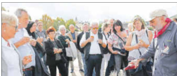
Pfälzer Stadtrundgang mit Weinverkostung