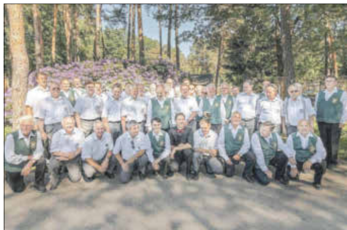
Nach dem Konzert – Fotoclub Reflex Weixdorf e. V.

Allen beteiligten Musikern, den Chor- und Orchesterleitern, dem Team der Köhlerhütte und den so zahlreich erschienenen Gästen, die nicht mit Beifall sparten, gilt unser Dank für das wirklich gelungene Pfiingstkonzert 2018!