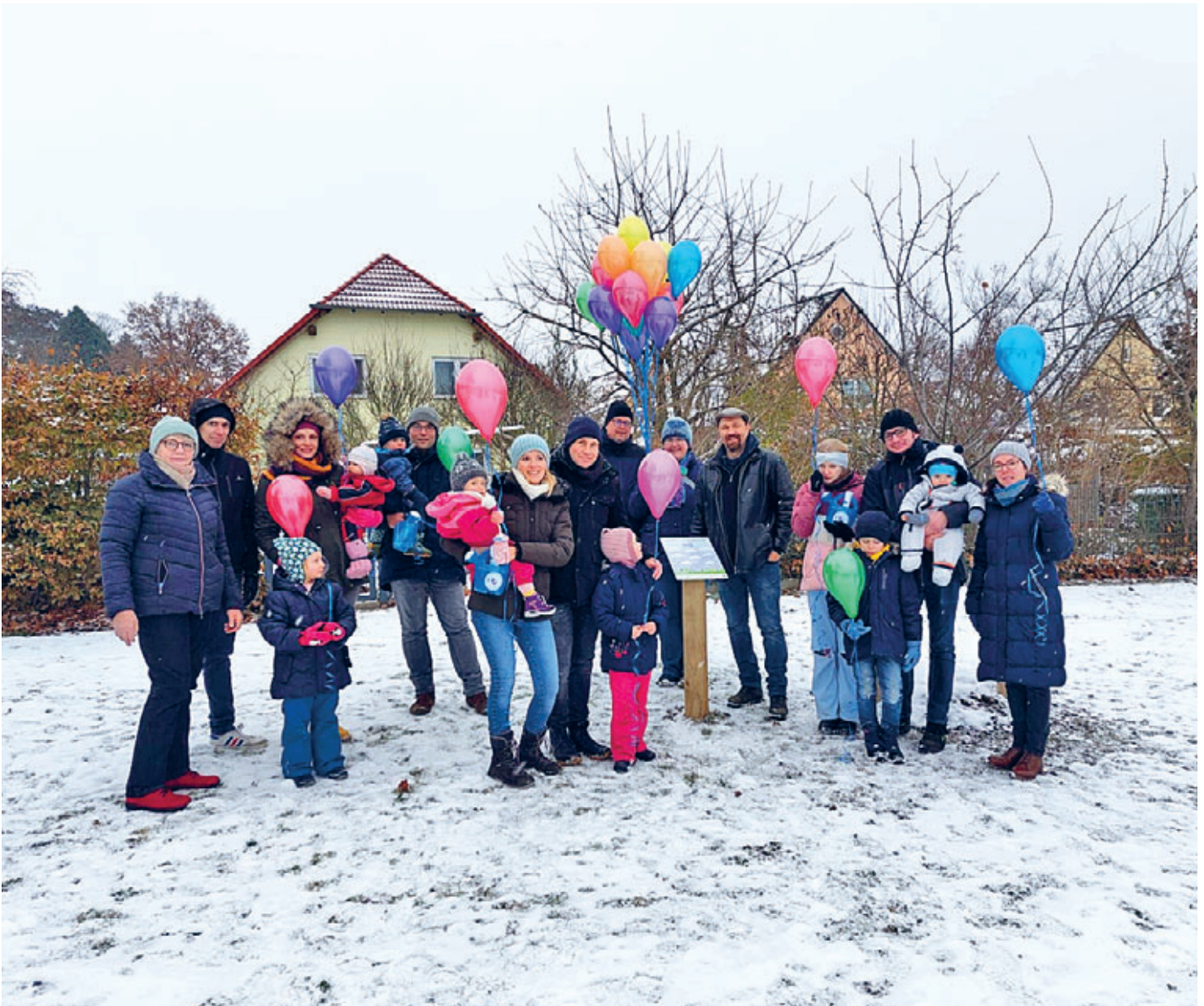
Winterliche Bedingungen bei der Pflanzfeier mit Enthüllung der Namenstafel für die im Jahr 2022 in Weixdorf geborenen Kinder.