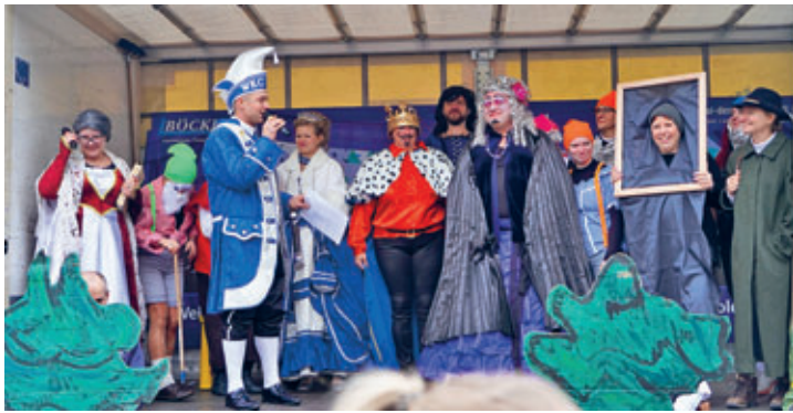
Programm mit Kostümshow