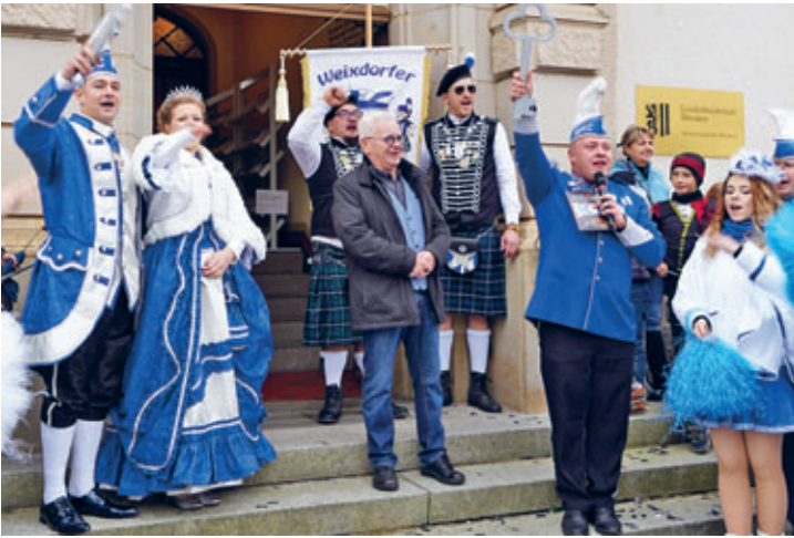
Schlüsselübergabe vor dem Rathaus