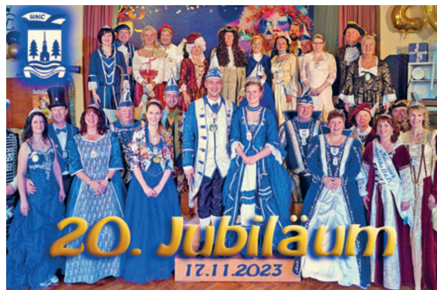
Prinzenpaare des WKC ab 2003