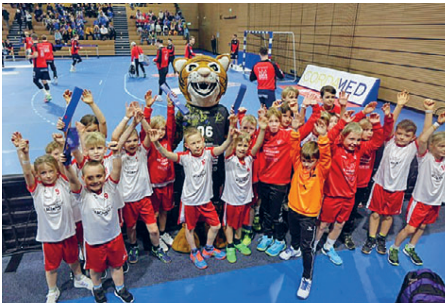
Die Handball-Minis der SG Weixdorf mit dem Masskottchen des HC Elbflorenz.

„Das war cool“, sagen Kate und Maya fast gleichzeitig, als sie wieder auf ihren Plätzen sitzen. Eben sind sie noch durch Leuchtstäbe und künstlichen Nebel in die Halle gelaufen. Vor mehr als 2000 Zuschauern