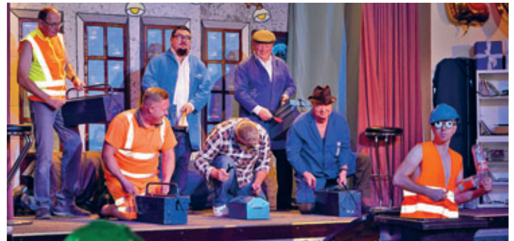
Handwerker im alten Kino

Gleich am nächsten Tag ging es im Gasthof Hermsdorf mit dem Senioren- und Familienfasching weiter. Die Veranstaltung war ausverkauft und alle Gäste brachten beste Laune mit. Ebenso viel Spaß hatten wir mit unseren Gästen am Samstag, dem 18.11.2023 während unserer Abendveranstaltung.