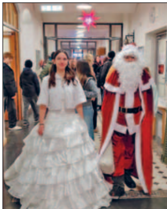
Der Weihnachtsmann und sein Engel kamen vorbei

Am 27.11.2025 fand unser traditioneller Weihnachtsmarkt in der Oberschule Weixdorf statt. Die Christbäume in der Pausenhalle und der Aula leuchteten im hellen Glanz. Auch der Weihnachtsmann war dieses Jahr wieder mit dem Motorrad da und war erneut ein beliebtestes Fotomotiv.