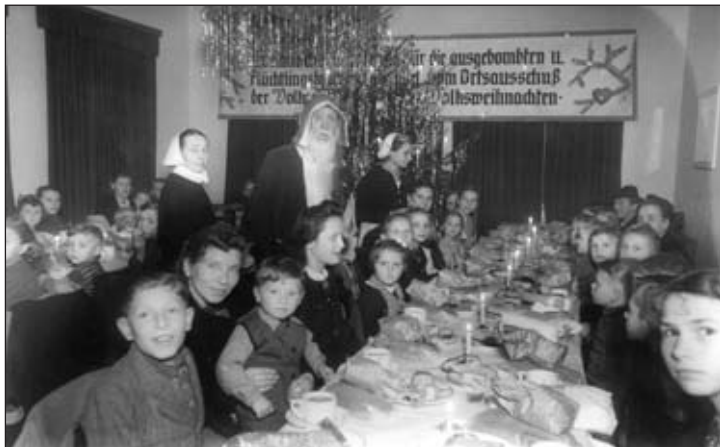
Der vorstehende Text von Rudolf Dreßler wurde leicht bearbeitet. Die 1. Weihnachtsfeier des Ortes mit 150 Teilnehmern fand in den Räu-

waren die strahlenden, frohen Gesichter der Umsiedler und Ausgebombten oder die Freude der Kinder. Außerdem hatten sie die Gewißheit, etwas beigesteuert zu haben, um die Not zu lindern, die so viele betroffen hatte. Lange noch sprach man von diesen beiden Konzerten in den Läden, auf der Straße und in den Familien.