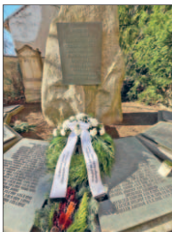
Kranzniederlegung in Weixdorf

Der Zweite Weltkrieg, sein Beginn und sein Ende, seien zugleich eine eindringliche Mahnung, dass Demokratien wehrhaft und solidarisch sein müssen, um sich gegen aggressive Mächte zu behaupten. Am angemessenen Umgang mit den Toten zeige sich die Menschlichkeit einer Gesellschaft. Im Angesicht des Todes stellten sich die großen Fragen nach dem Sinn des menschlichen Lebens. Es sei nicht