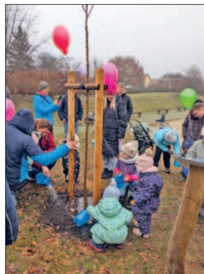
Der Baum wurde von den Kindern mit den geschenkten Kannen reichlich gegossen.

10 Kinder wurden dafür angemeldet. Deren Vornamen und Geburtsmonat stehen nun für das Jahr 2024 darauf. Nach der gemeinsamen Enthüllung bekam jedes Kind eine kleine Gießkanne geschenkt. Damit wurde dann die Peterbirne ordentlich unter Wasser gesetzt. Damit sie sich, wie schon die vier bereits gepflanzten Jahrgangs-bäume, gut entwickelt. Denn in den kommenden Jahren entsteht hier mit den weiteren Bäumen ein Lehrpfad für den Unterricht der Grundschule. Informationen dazu gibt es auf der Homepage des Fördervereins www.foerderverein-grundschule-weixdorf.de .