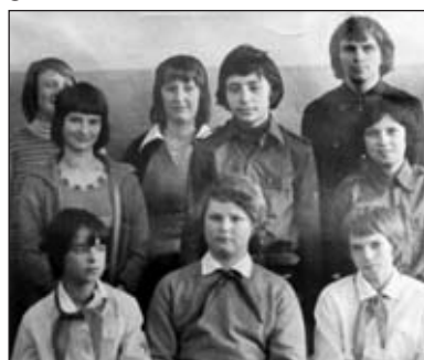
Gründungsfoto von 1974