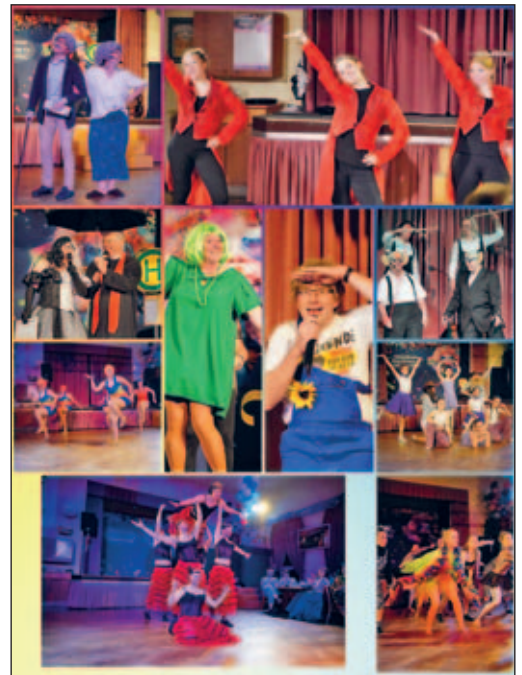
Eindrücke aus den ersten Veranstaltungen

Die Abendveranstaltung am 22.11. haben wir trotz vieler krankheitsbedingter Ausfälle grandios über die Bühne gebracht. Vor nahezu ausverkaufter Saal und einer Menge toller Kostüme haben wir die heiligen Hallen vom Gasthof Hermsdorf wieder zum Glühen gebracht.