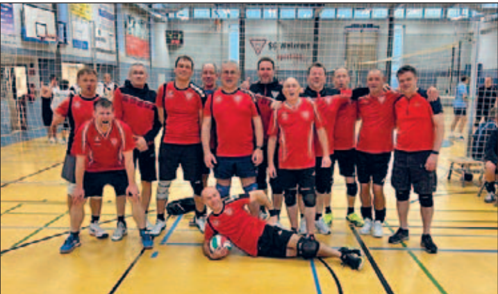
Weixvolleys I & II

Nach der Premiere des Ü45 Turniers im Jahr 2019 trafen sich zum 5. Mal die „erfahrenen“ Volleyballenthusiasten am 15. November 2025 in der vereinseigenen Gerhard-Grafe-Sporthalle in Weixdorf, um die derzeit Besten der Region in dieser Altersklasse zu ermitteln. So waren es 9 Mannschaften, welche sich am Samstag ab 8:30 Uhr in der Halle einfanden und bis 15:30 Uhr den Besten dieses Tages ermitteln wollten.