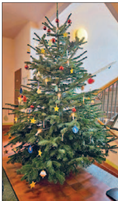
Der schön geschmückte Weihnachtsbaum im Rathaus Weixdorf

Wir haben das Bäumchen flüstern hören, dass es sich freut, wenn es von den Weixdorfern bewundert wird.