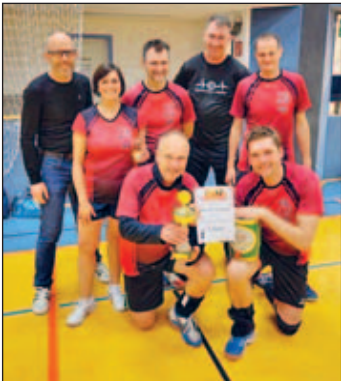
Die Sieger „Freizeitblocker“