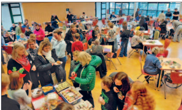
Für das leibliche Wohl war gesorgt

-Ringe konnten u.a. gebastelt werden. Natürlich war auch für das leibliche Wohl in unserem Café in der Aula, im Schlemmertempel oder in der Grillecke gesorgt, dort schmeckte auch der Kinderpunsch oder Glühwein lecker. Am Lagerfeuer oder im Café wurde munter gequasselt, denn viele