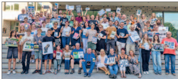
50 Jahre AG Foto (7.9.2024)

Im September 2024 feierte er mit 126 ehemaligen AG Foto Schülern das 50-jährige Jubiläum der AG Foto.