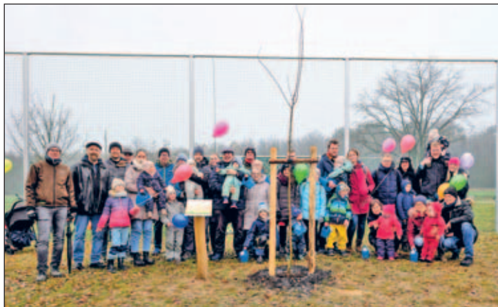
Die Familien der 2024 in Weixdorf geborenen Kinder kamen trotz des trüben Novemberwetters zur Enthüllung der Namenstafel am Jahrgangsbaum der Ortschaft.

Der Förderverein Grundschule Weixdorf, der im Auftrag der Ortschaft die Organisation der Pflanzfeier und das ganzen „Drumherums“ übernimmt, hatte am Morgen noch die von GSI DESIGN gestaltete Namens-