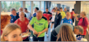
Anstehen war angesagt

wunderbare Pokale und die Plätze 4 + 5 noch einen „fliegenden Teppich“, welcher vom Getränkemarkt bereitgestellt wurde. Traditionell gab es 6-Packs mit regionalen Getränken und für die teilnehmenden Frauen eine kleine Flasche Rose.