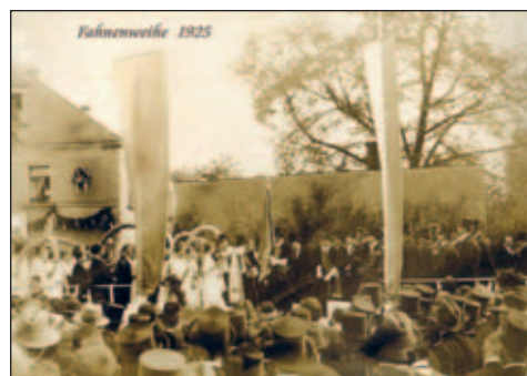
1925 - 40 jähriges Jubiläum und Fahnenweihe der ersten Vereinsfahne.

Wir feiern in diesem Jahr 140 Jahre Männergesangverein Lausa/Weixdorf 1885 e.V. Damit sind wir der älteste Verein unserer Ortschaft mit einer reichen Tradition und einer hoffentlich noch bunten Zukunft. Wir möchten Sie schon an dieser Textstelle recht herzlich zu unserem Jubiläumskonzert am 18.