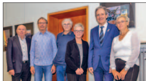
Gruppenfoto Fotoclub Reflex mit Bürgermeister Göck