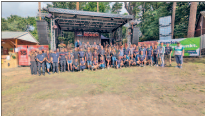
Ein Teil der Mitglieder, Jury und ehrenamtlichen Helfern

Wenn wir als kleiner Verein auf die diesjährige Veranstaltung zurückblicken, erfüllt uns der Rückblick auf den Tag, mit enorm viel Stolz. Natürlich wäre das alles ohne die mittlerweile über 100 ehrenamtlichen Helfer, unzähligen lokalen Sponsoren und unsere Vereinsmitglieder nicht möglich.