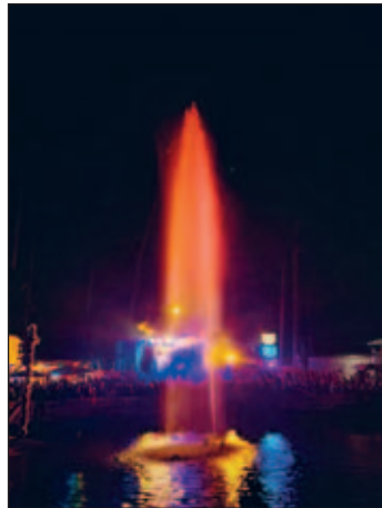
Abendstimmung beim Badewannenrennen 2025

Wir möchten uns nochmals ganz herzlich bei allen Gästen, Helfern, Sponsoren und sämtlichen Unterstützern bedanken.