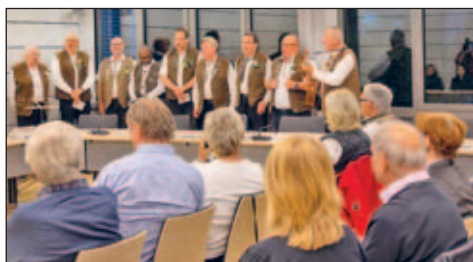
Kerweborsche eröffnen die Vernissage der Fotoausstellung vom Fotoclub Reflex