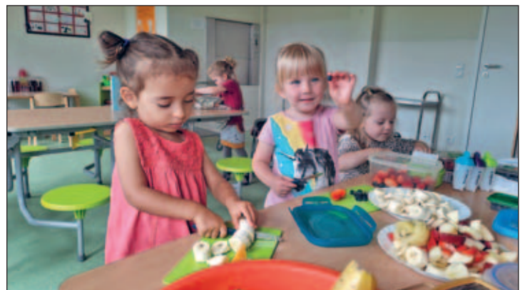
Obst schneiden für die Smoothies