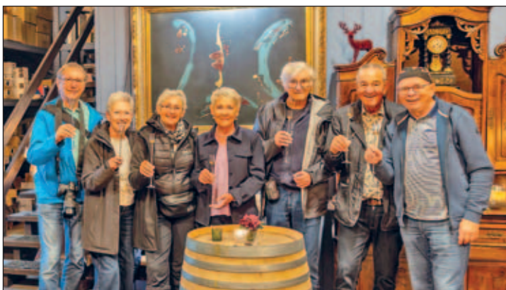
Weinessigverkostung im Weinessiggut Doktorenhof