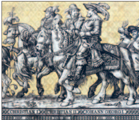
Kurfürst Johann Georg I. (vom mit Federbusch) im Dresdner Fürstenzug.

Im Verlauf des 30jährigen Krieges wechselte der sächsische Kurfürst Johann Georg I. (1611-1656) mehrfach die Seiten (siehe Bild). Zuletzt verließ er das Bündnis mit Schweden und schloß am 30. Mai 1635 mit dem böhmischen König und römisch-deutschen Kaiser Ferdinand II. den „Prager Frieden“. Als Dank erhielt er die Ober- und die Unterlausitz.