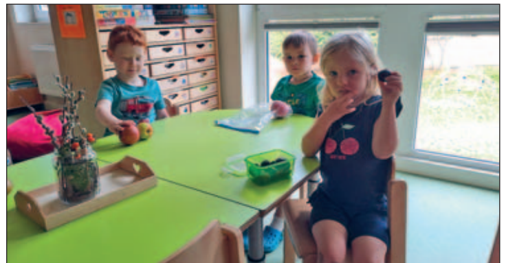
Kinder zeigen stolz ihre eigenen Früchte aus dem Garten

Zum Erntedankfest am 09.10.2025 ernten alle Gruppen vom Kindergarten „Heideland“ das selbstangebaute Gemüse und bereiten verschiedene Suppen zu.