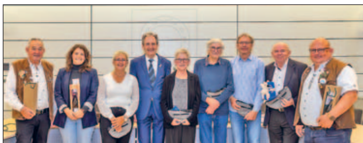
Fotoclub Reflex mit Bürgermeister Ralf Göck und Brühlern

Weiter ging es nach St. Martin, einen Wein- und Luftkurort. Das Bouquet des Weines in der Luft des malerischen Ortes zu riechen war schon was Besonderes. Über Freinsheim ging es dann wieder nach Brühl. Am Mittwoch hingen wir die Fotos in den 3 Etagen des Rathauses auf.