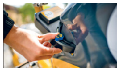
Beenden der MOBibike-Ausleihe durch Betätigen des blauen Hebels und Schließen des Ringschlusses