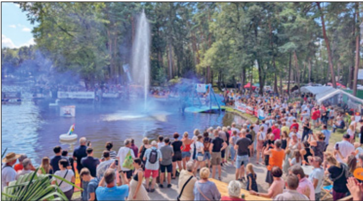
zahlreiche Besucher im vergangenen Jahr

entstanden und wir haben darüber nachgedacht, ob das denn so eine gute Idee sei. Rückblickend können wir sagen: ja!!!, die Idee war super. Allerdings wäre die jährliche Veranstaltung ohne die Hilfe aller Vereinsmitglieder, den unzähligen freiwilligen Helfern, den befreundeten Vereinen aus dem Dorf und natürlich den zahlreichen Firmen die uns unterstützen, nicht möglich. Aber jetzt genug in der Vergangenheit geschwelgt.