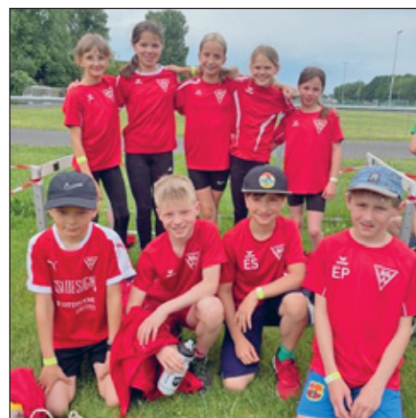
Unsere Staffel für den Talents Cup beim Goldenen Oval 2025