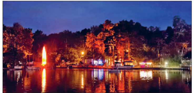
Waldbad am Abend

Aber es wäre ja nicht das 5. Badewannenrennen, wenn wir nicht noch mehr Highlights parat hätten. Dieses Jahr wird es zum Abendprogramm erstmals Live-Musik von der Band Restroskop geben. Gegen 18 Uhr wird die Siegerehrung aller Klassen und der 3 verschiedenen Kategorien stattfinden. Und dann geht es mit Vollgas in unsere After-Race-Party bis 24 Uhr . Für die passende Stimmung verwandeln wir das Waldbad wieder in ein Lichtermeer und lassen euch zu den Klängen von den DJs Brothers'N'Glorious, Alex Sky und DJ Nafets feiern.