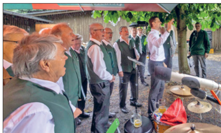
Männerchor singt im Regen

Doch schon nach wenigen Liedern fielen erste Tropfen, und wir mussten die empfindlichen Mikrophone und die Tontechnik gegen die Nässe sichern und abschalten. Tatsächlich gab es dann einen langdauernden, starken Regenguss. Doch wir wollten den Besuchern des Biergartens die Freude nicht verderben und setzten unser Programm fort, geschützt unter einem großen Sonnenschirm und ohne Verstärkung durch die Technik. Zahlreiche Besucher harreten trotz des Regens im Biergarten aus, und wir konnten sie mit unserem Gesang auch ohne Lautsprecher-technik gut unterhalten.