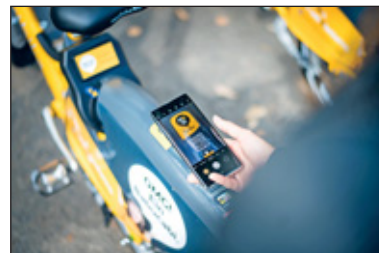
Start der MOBIbike-Ausleihe durch Scannen des QR-Codes

per App ein Fahrrad in der Nähe finden, durch Scannen des QR-Codes oder Eingabe der Radnummer entsperren und losradeln. Bei der Rückgabe ist das Rad platzsparend abzustellen, sodass es den Weg nicht versperrt und der blaue Hebel am Hinterrad muss geschlossen werden bis ein Piep-Signal ertönt. Alle Fahrten, Standorte etc. sind in der nextbike-App auffindbar.