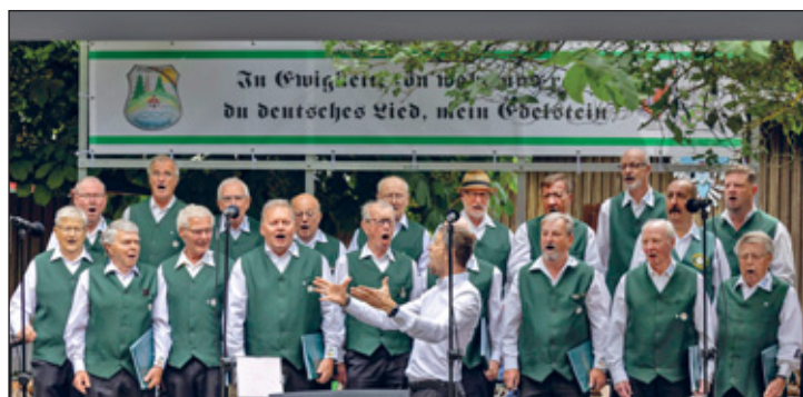
Pfingstkonzert in der Köhlerhütte