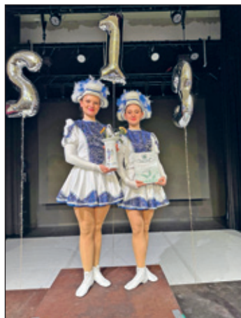
unser großes Pärchen