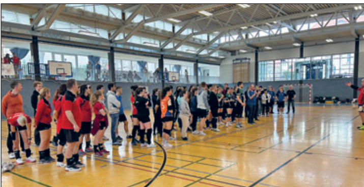
Die Teilnehmenden Teams nach dem Turnier

Am Samstag, den 5. April 2025 fand in der Gerhard- Grafe-Sporthalle in Weixdorf unser 1. Weixvolleys Volleyball Mixed Turnier statt. Aufgrund der Gegebenheiten hatten wir die Anzahl der Teilnehmende Mannschaften auf 12 Teams beschränkt. Pflicht war das mindestens 3 Frauen und 3 Männer auf dem Spielfeld stehen. Die Reihenfolge der eingehenden Anmeldungen entschied damit, wer am Turnier teilnehmen konnte. Insgesamt hatten sich letztendlich über 20 Teams für dieses Turnier interessiert, man merkt, dass der Wille da ist, sich sportlich zu betätigen.