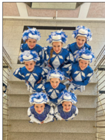
unsere große Garde

Am 05.04. fand in Oelsnitz das 28. Präsidententreffen statt. Neben der hauptsächlichen Präsidentaltagung der sächsischen Mitgliedsvereine des VSC gab es viele Möglichkeiten bei interessanten Gesprächen in verschiedenen Fachausschüssen, wie zum Beispiel Brauchtum und Programm, Gedanken auszutauschen und neue Informationen zu erhalten.