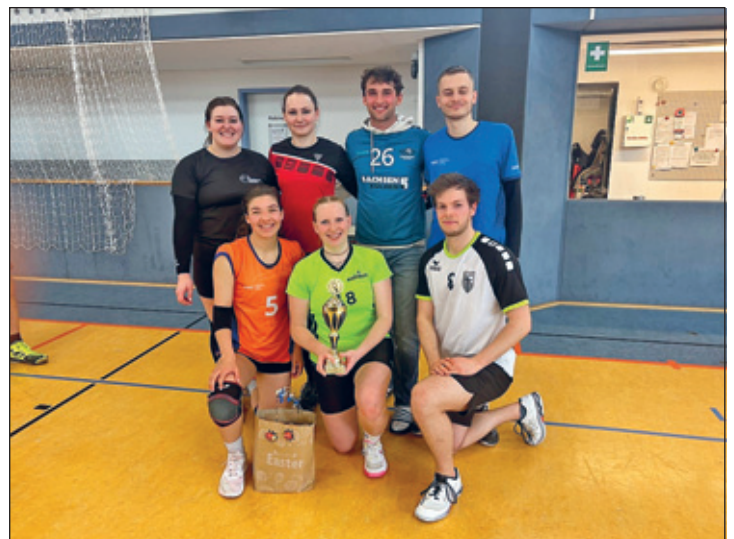
Die Sieger – VOLLEY FUSION

Am Ende konnten wir den 3 besten Teams wundervolle Pokale und selbst zusammengestellte Präsentie übergeben.