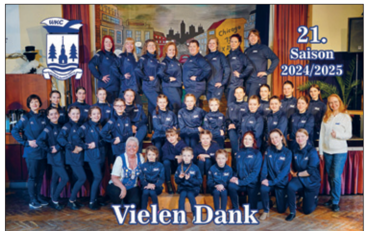
der WKC mit seinen neuen Trainingsanzügen