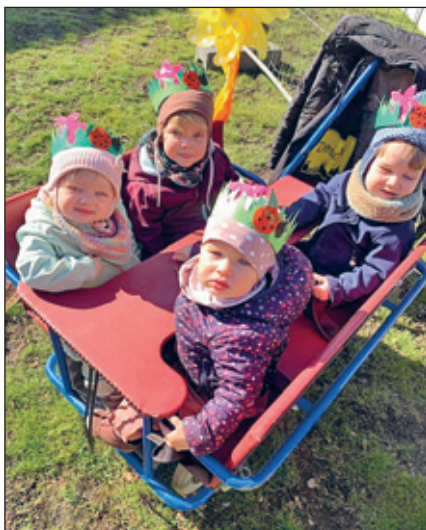
Spaziergang zum Spielplatz