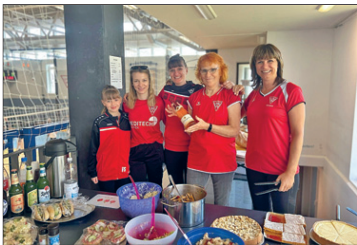
Das Catering Team

Turnieres beigetragen haben. Ein besonderes Highlight für die Neulinge war das prachtvolle Catering, welches durch unsere Mitglieder und Familien ausgerichtet wurde.