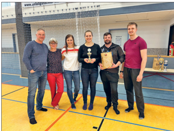
3. Platz – TSV Cossebaude