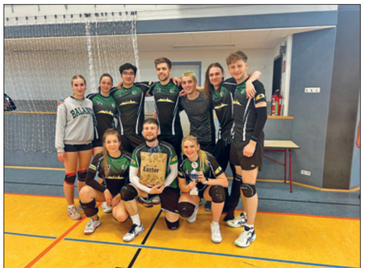
Platz 2 – Moralhüpfer

An dieser Stelle im Namen aller Aktiven und im Hintergrund Agierenden ganz herzlich Dank, welche zum Gelingen des 1. Weixvolleys Mixed-