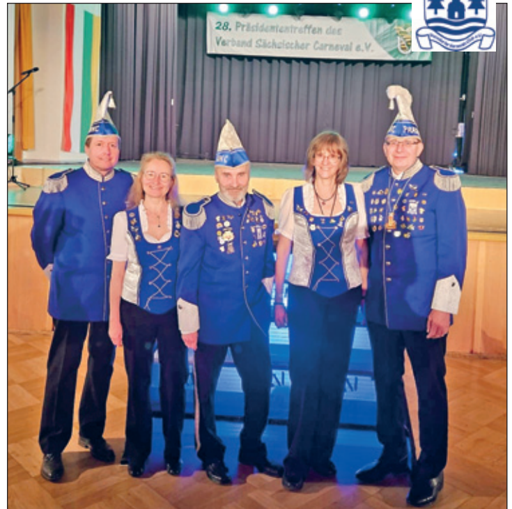
beim 29. Präsidententreffen in Oelsnitz

Als Abschluß wurde der Staffelnstab für die Ausrichtung des 29. Präsidententreffen in Dresden an die 6 Dresdner Vereine Elferrat Gebau, Karnevalsclub Bannewitz, Karnevalsverein Langebrück, Karnevalsclub Großhermannsdorf, Dresdner Carnevals Club und den WKC übergeben.