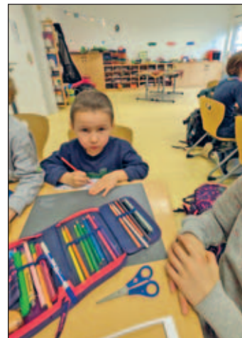
Besuch in der Grundschule Weixdorf