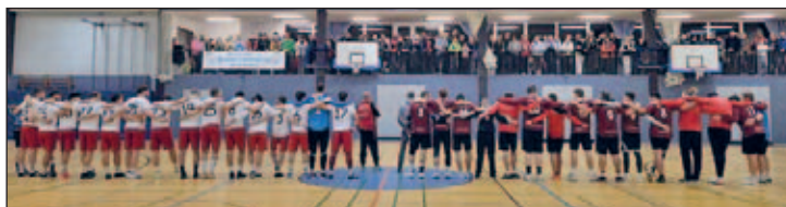
Die Fußball- und Handball-Mannschaften beim Derby