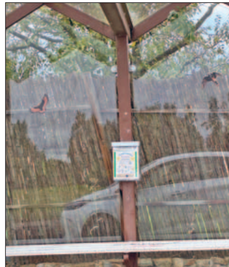
Prospektbox an der Bushaltestelle „Alte Dresdner Straße“