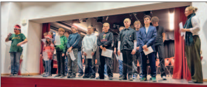
Schülerinnen und Schüler der 8. Klasse zusammen mit Frau Bischoff und Herrn Dubrau

Text und Bild: Yvonne Hänig, Sabine Großer – Sachbearbeiterinnen