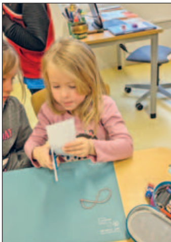
Zusammen basteln mit den großen Schülern

Wir danken den 4. Klassen der Grundschule Weixdorf für den schönen, erlebnisreichen Vorlesestag. Die Kinder der Spatzengruppe können es kaum erwarten in die Schule zu kommen und selbst Lesen zu lernen.