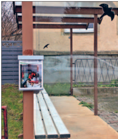
Prospektbox an der Bushaltestelle „Medinger Straße“

Text und Bild: Yvonne Hänig, Sachbearbeiterin