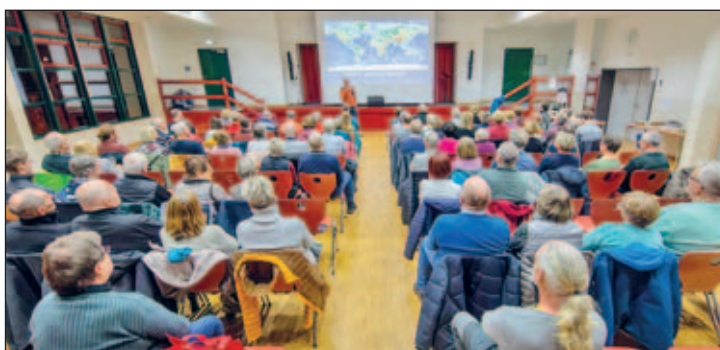
Fotoshow vom Fotoclub Reflex

Text und Foto: Christian Scholz, Fotoclub Reflex e.V.