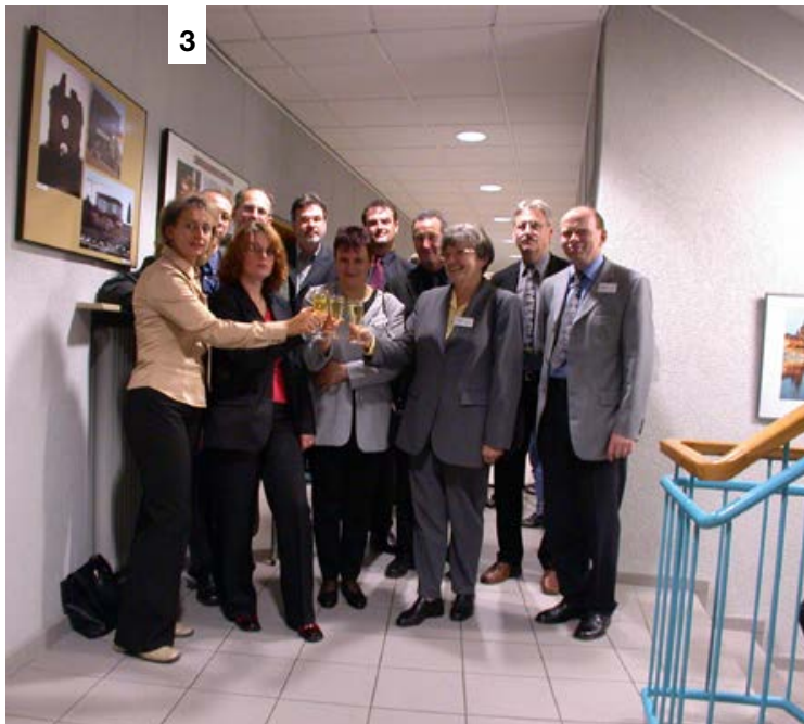
4) Benefizveranstaltung 2002 für die Hochwasseropfer Dresden/Weixdorf