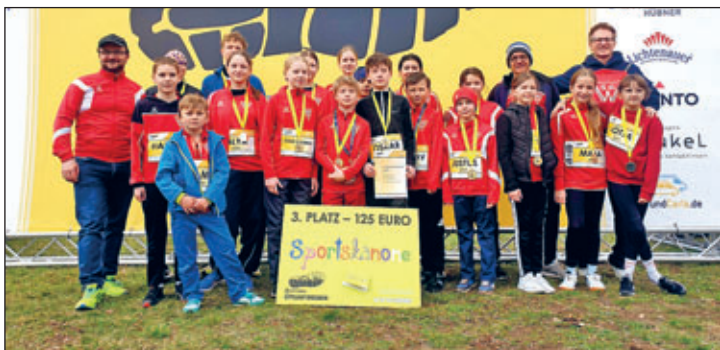
Das Team mit Auszeichnung