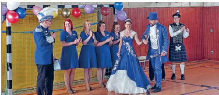
Das Prinzenpaar vom WKC

Am Dienstag, den 04.03.25 hieß es im Hort Heideland „Helau und Hurra“, denn es wurde Fasching gefeiert.