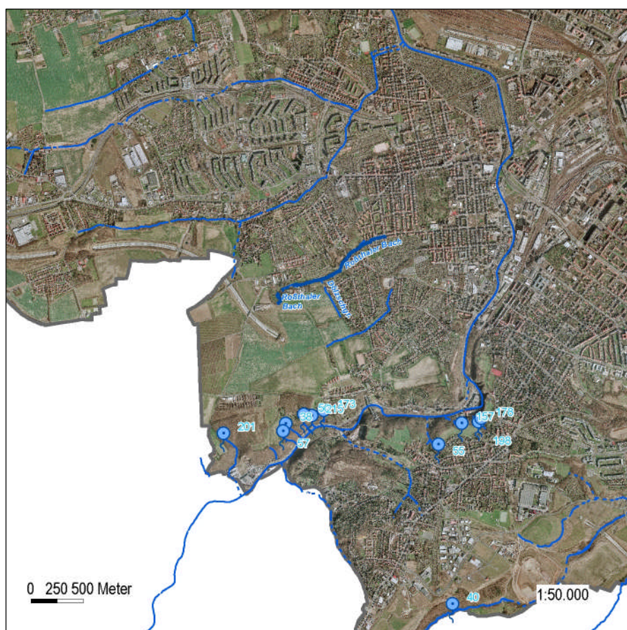
Abb. 1: Roßthaler Bach