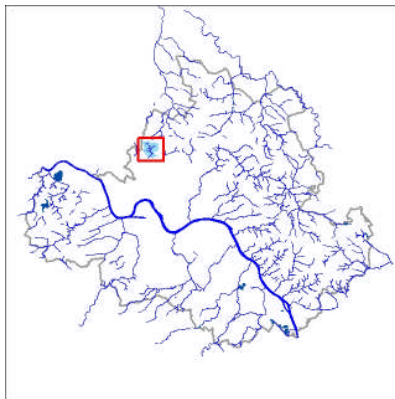
Abb. 1: Pfarrbuschgraben