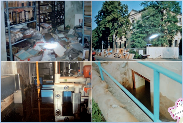
Das Archiv nach der Flut – geborgene Teile zum aussortieren – Heizhaus unter Wasser – Wasserstand im Eingang zur Sporthalle (von l.o. nach r.u.)