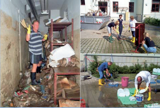
Alle Küchengüter und Lebensmittel wurden völlig vernichtet – fleißige Menschen bei der Reinigung des Mobiliars... (r.o.) und von Küchengegenständen (r.u.)