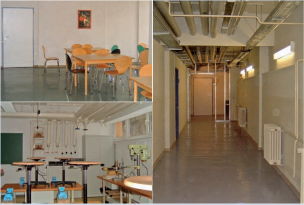
Neu gestalteter freier Arbeitsbereich (l.o.) – sanierter Werkraum (l.u.) – Kellergang nach der Fertigstellung