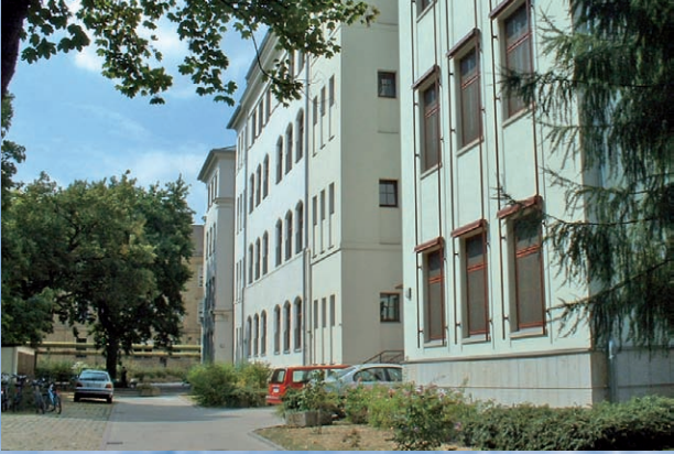
Die Schule nach Beseitigung der Flutschäden und regulärer Sanierung.