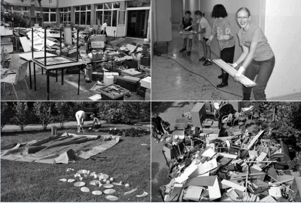
Geborgene Gegenstände und Ausstattungen aus dem Kellerbereich – Reinigung des vom Wasser befreiten Kellers – gerettete Geschirrtelle zur Reinigung – von diesen Teilen war nicht mehr viel zu retten (von l.o. nach r.u.)