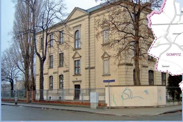
Schulgebäude nach dem Aufräumen