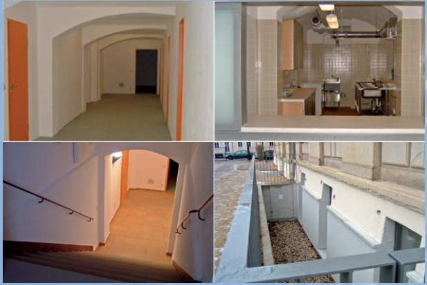
Kellergang – Ausgabe der Speisung – Abgang zum Keller – Außengelände nach der Sanierung (von l.o. nach r.u.)