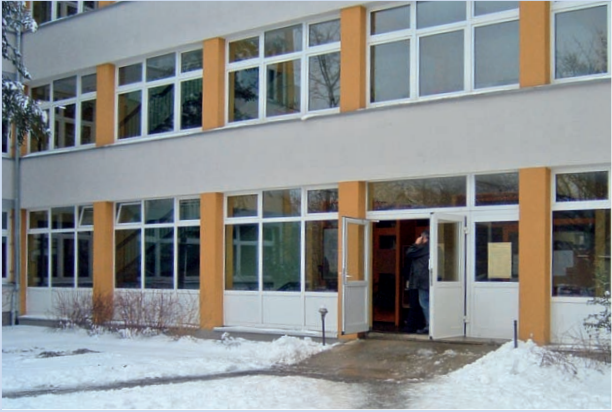
Eingangsbereich nach der Sanierung