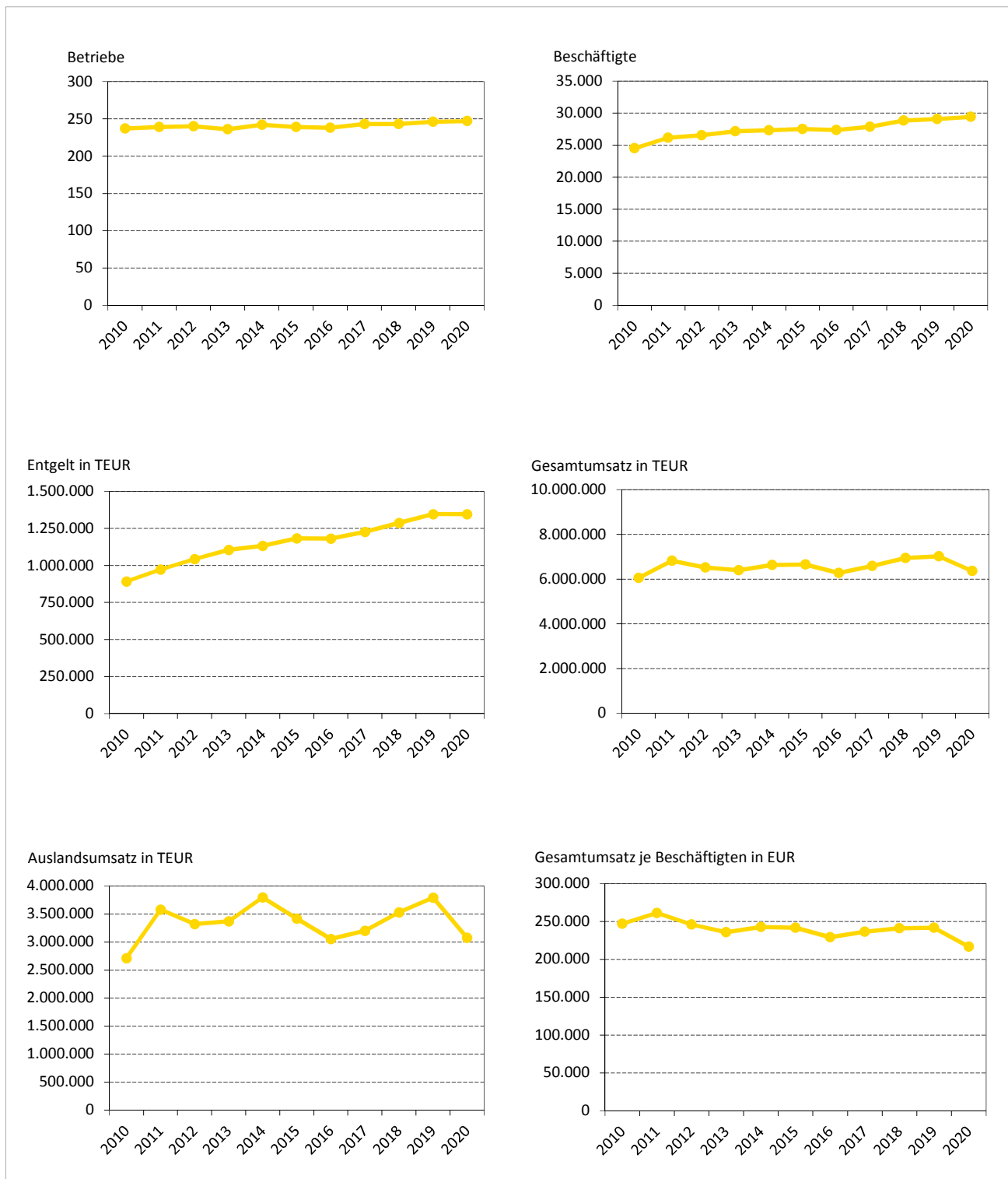
Abb. 3: Betriebe, Beschäftigte, Entgelt und Umsatz insgesamt