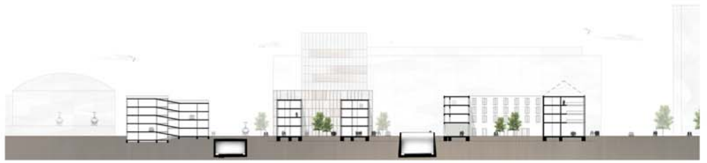
Schnitt H1 1:500