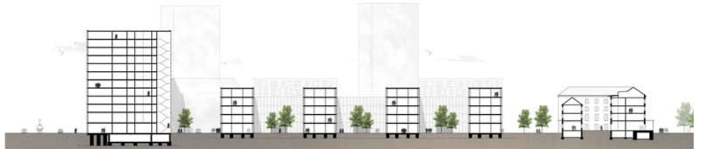
Schnitt H2 1:500