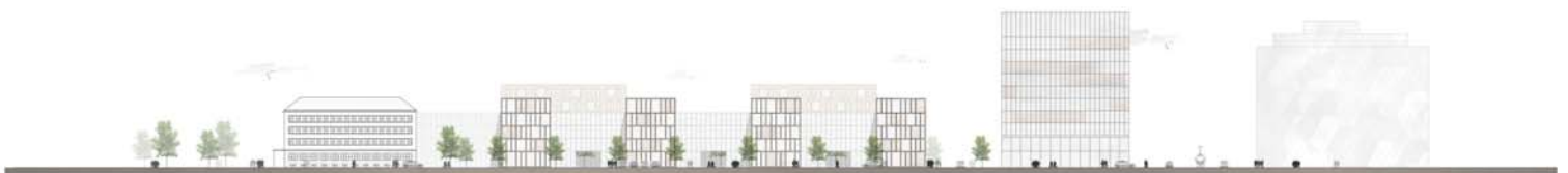
Ansicht Eschlebungstraße NEU 1:500