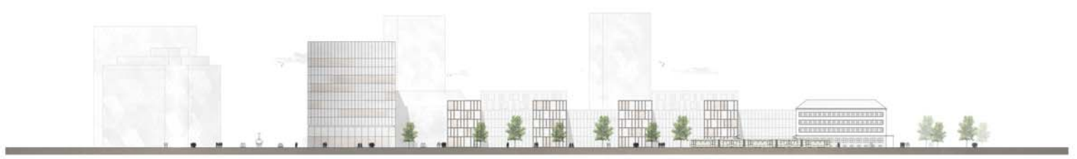
Ansicht Wiener Straße 1:500