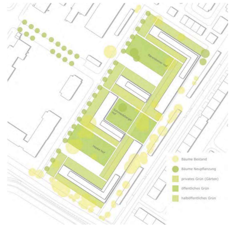
Freiraumkonzept M 1/1000

PEGASUS Courtyard Dresden GmbH Werkstattverfahren Wohnbebauung Hepke Straße