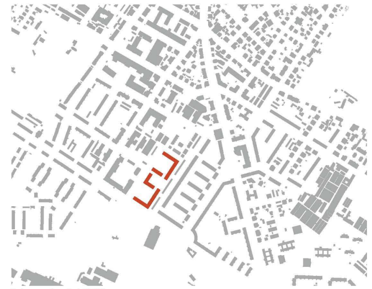
Schwarzplan M 1/5000