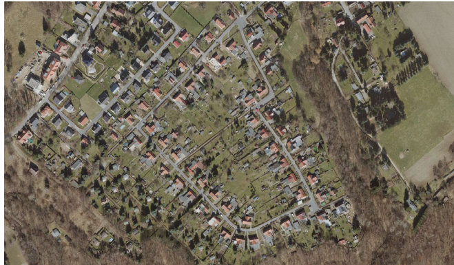
Luftbild Kleinsiedlung Rochwitz

Thema der Fibel ist, für das baukulturelle Erbe zu sensibilisieren. So ist es möglich, zukünftige