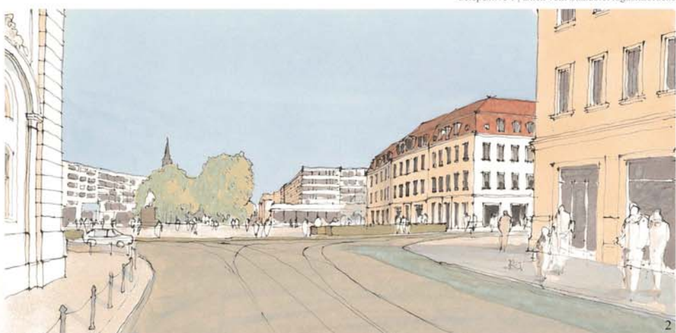
Perspektive 2 | Blick auf den Neustädter Markt