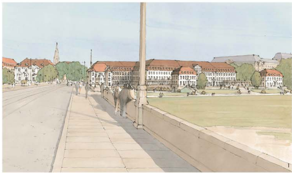
Perspektive 1 | Blick vom Standort Augustusbrücke