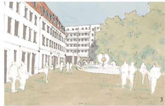
Perspektive 3 | Blick auf den Neustädter Markt