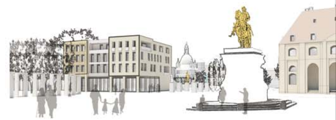
Perspektive vom Neustädter Markt