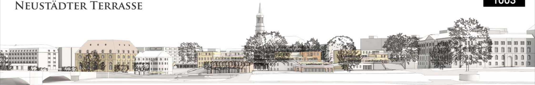
Blick von Brühlscher Terrasse