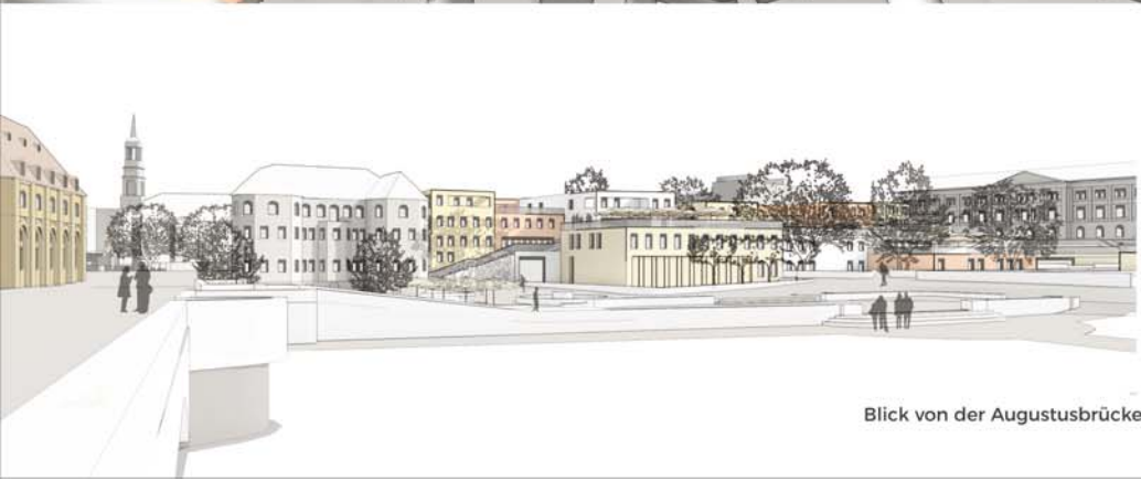
Blick von der Augustusbrücke