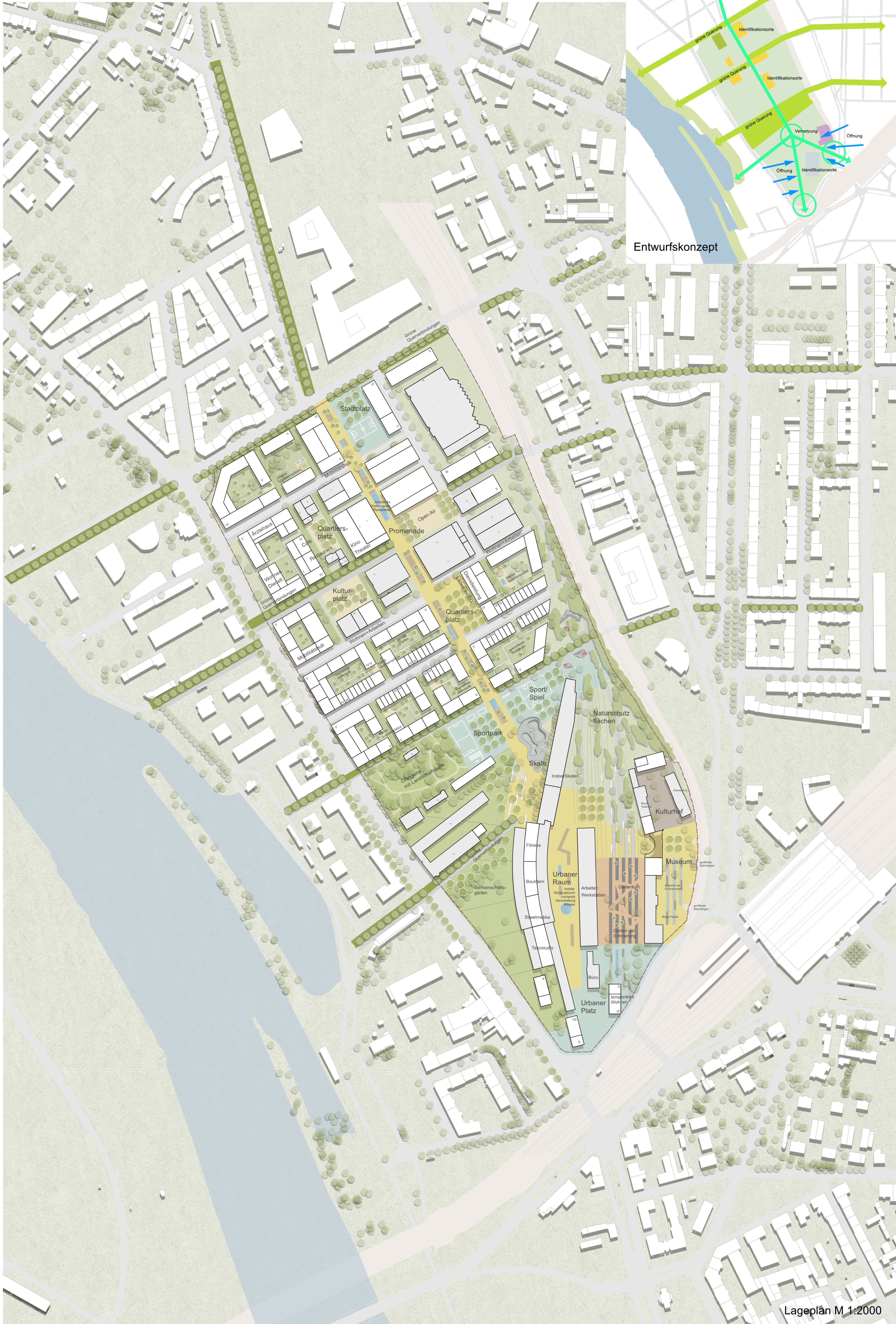
Lageplan M 1:2000