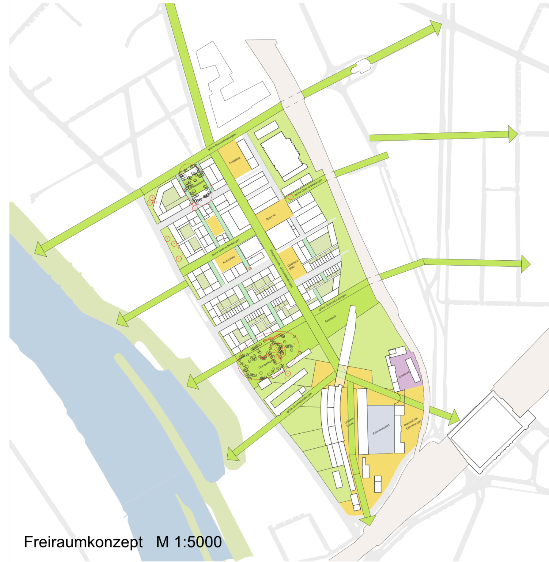
Freiraumkonzept M 1:5000