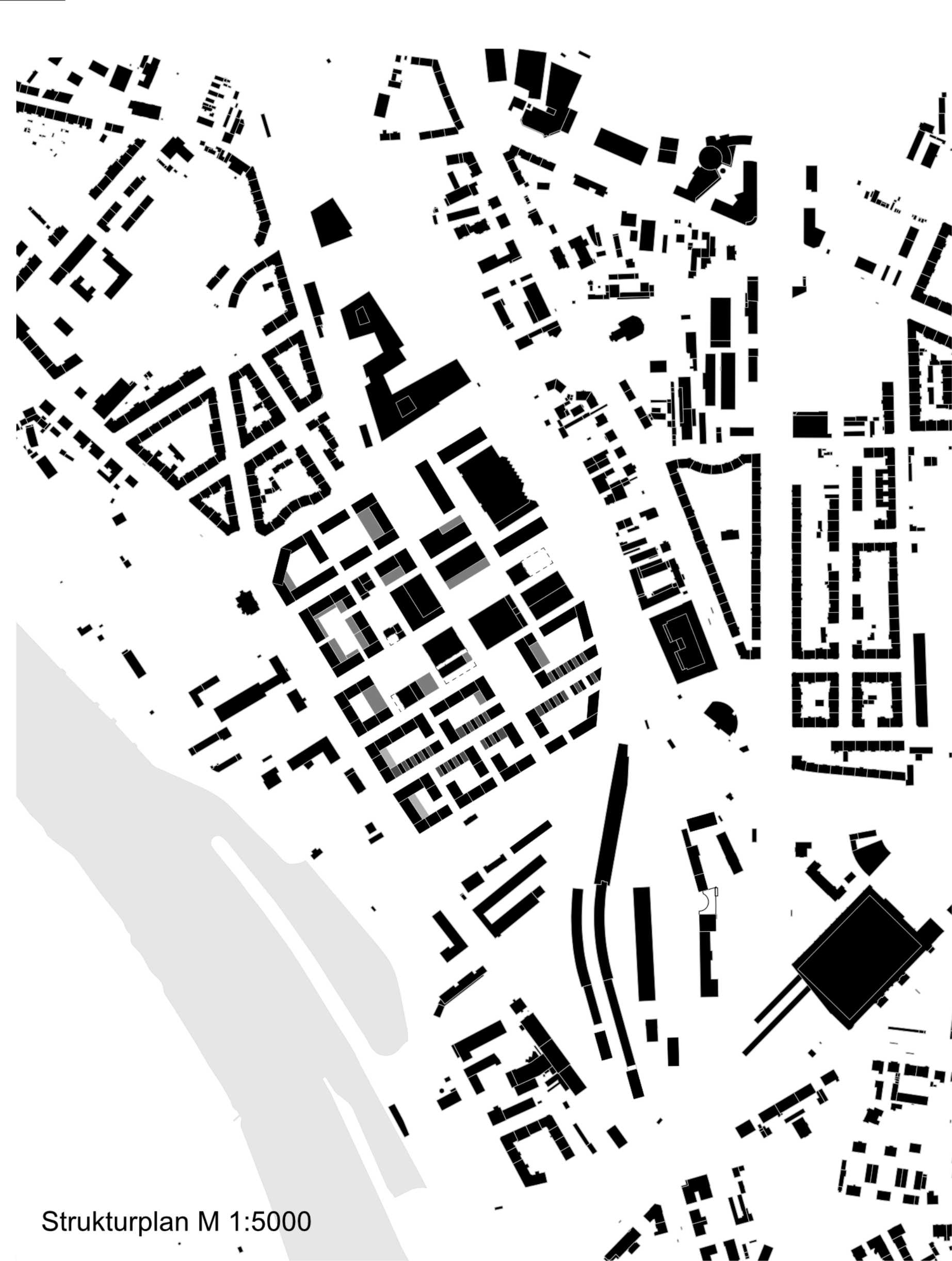
Strukturplan M 1:5000