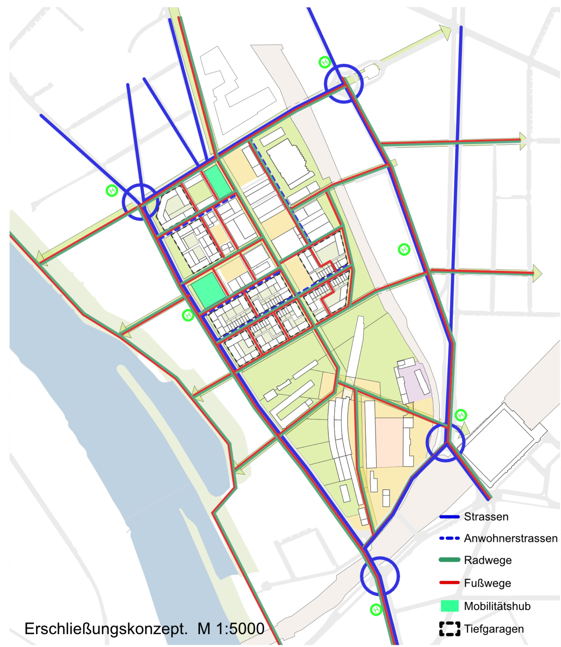
Erschließungskonzept. M 1:5000