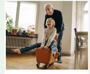
Bewegung wirksam unterstützen