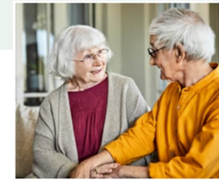
Verstehst du mich?