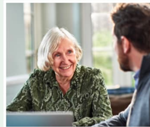
Pflegeversicherung & Co.