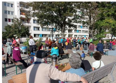
Der interkulturelle Chor Singasylum beim Auftritt zum Johannstädter Plattenwechsel.