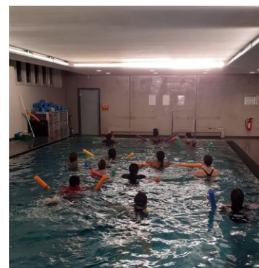
Frauen beim Schwimmkurs von Willkommen in Löbtau.

Kontakt: eva.hesse@willkommen-in-loebtau.de