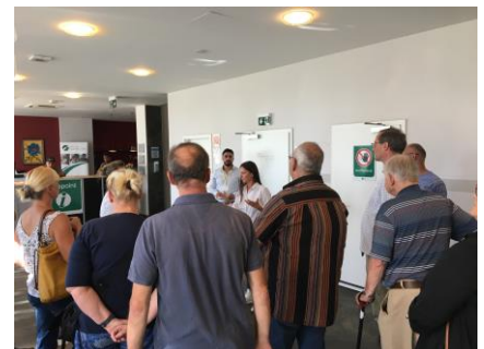
Foto links: Blick in ein Zweibettzimmer in der Cityherberge. Foto Mitte: Mehr als 100 Personen informierten sich am Tag der offenen Tür am 06.09.2023 über die neue Unterkunft. Foto rechts: Die Besucher wurden in Gruppen durch die Einrichtung geführt.