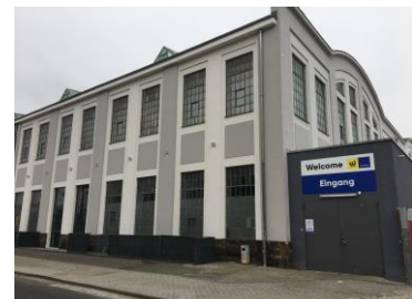
Im Eventwerk in der Herrmann-Mende-Str. 1 sind derzeit rund 170 Geflüchtete untergebracht.