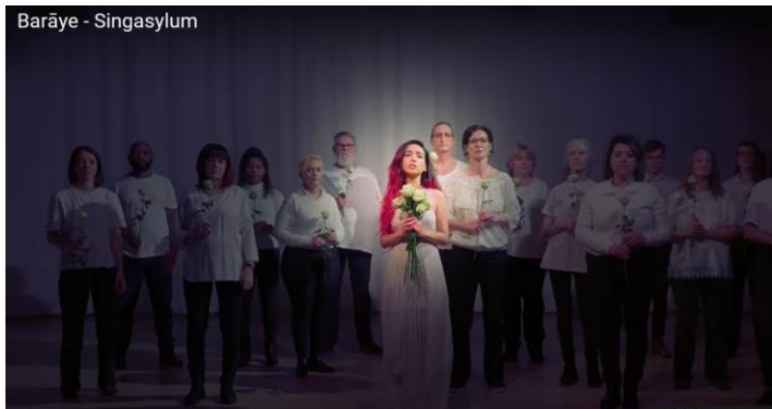
Barāye - Singasylum

Presseinformation des Vereins Singasylum