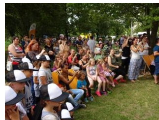
Familienfest in Leuben: Foto: Leuben ist bunt

Am 07.9.2018 findet zum 7. Mal das Leubener Familienfest für die Kinder und Eltern des Stadtteils und darüber hinaus von 15 bis 19 Uhr statt. Das Fest, das auf der Wiese zwischen Rottwernerdorfer Str. 1 und 3 stattfindet, hat sich damit als feste Größe im Stadtteil etablieren können. Die Feste in den letzten Jahren waren immer ein großer Erfolg. Es gab u.a. Ponyreiten, eine Hüpfburg, ein Kettenkarussell, ein breites Kulturprogramm, Kistenklettern und viele tolle kreative Angebote für Groß und Klein. Mehrere hundert Menschen besuchten die Feste.