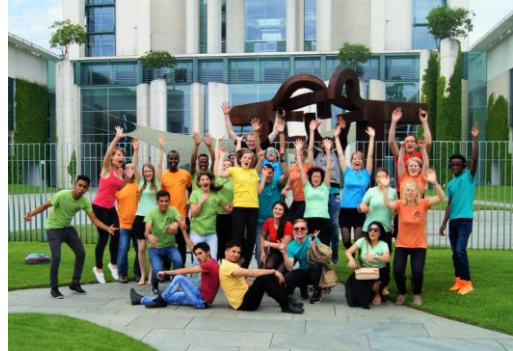
Singasylum vor dem Bundeskanzleramt in Berlin

Kontakt: singasylum@gmail.com / Facebook (Singasylum Dresden/Singasylum Gorbitz)