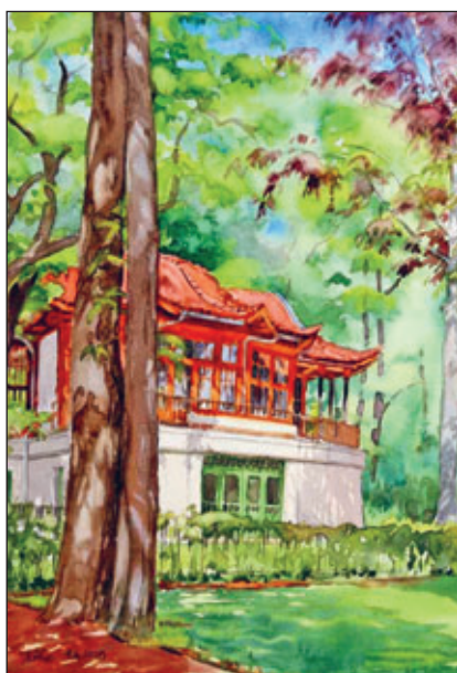
Chinesischer Pavillon Dresden Weißer Hirsch gemalt von Steffen Köbe

Seit dem 21. Mai 2023 zeigen wir im Ausstellungsraum des Kleinbauernmuseums Aquarelle von Steffen Köbe. Er hat uns eine Auswahl seiner Werke zur Verfügung gestellt, die „Lust auf Farbe“ machen. So malte er unter anderem den kleinen chinesischen Pavillon auf dem Weißen Hirsch, der versteckt in der, zu neuem Grün erwachten, Natur zu sehen ist. Auf einem anderen Bild hält Herr Köbe einen Herbsttag mit seinem bunten Farbenspiel am Schloss Moritzburg für den Betrachter fest. Eingefangen mit Pinsel und Farbe und viel Liebe zum Detail wird uns auch ein Blick auf den Zwinger, das Blaue Wunder und viele weitere schöne Objekte gewährt. Wir freuen uns, dass wir Ihnen diese Ausstellung noch bis Ende August hier im Museum präsentieren können. Nun können Sie sich schon überlegen, wann Sie sich auf den Weg ins Kleinbauernmuseum machen, um alle Bilder anzusehen und um selbst auch „Lust auf Farbe“ zur bekommen.