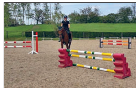
Alvin und die neuen Stangen und Ständer für Sprunghindernisse, Quelle: Annegret Steingraber

einem Tag Gelände- training auf dem Tannehof in Neu-Krausch. Unsere drei Pferde mit den erwartungsvollen Reiterinnen haben die Aufgaben sehr gut gemeistert. Größte Herausforderung war der Wassergraben, den kennen die Pferde ja nun gar nicht. Mit viel