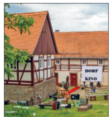
Freiluftkino im Kleinbauernmuseum

■ Kontakt: Heimatverein Schönfelder Hochland e. V., Kleinbauernmuseum Reitzendorf, Schullwitzer Straße 3, 01328 Dresden Telefon: 03 51 / 2 62 17 83, E-Mail: mail@kleinbauernmuseum.de , Homepage: www.kleinbauernmuseum.de