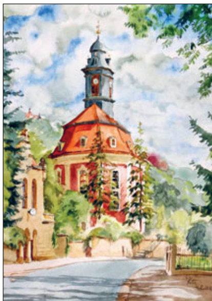
Loschwitzer Kirche gemalt von Steffen Köbe