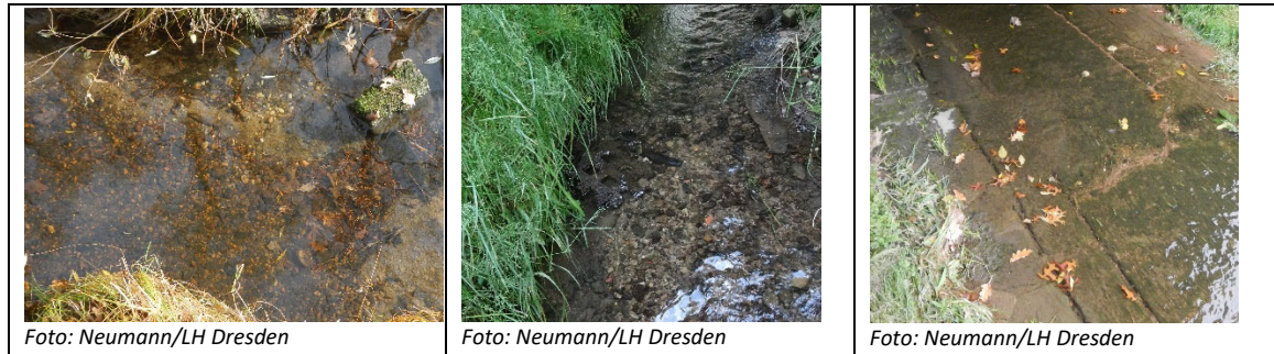
a) Bett naturnah/strukturiert b) teilweise naturnah c) naturfern/hart ausgebaut

2.5 Bitte kreuzen Sie an, welche Art des Gewässerbettes Sie bevorzugen! Betrachten Sie dazu nun die folgenden 3 Bilder zu Gewässerbetten.