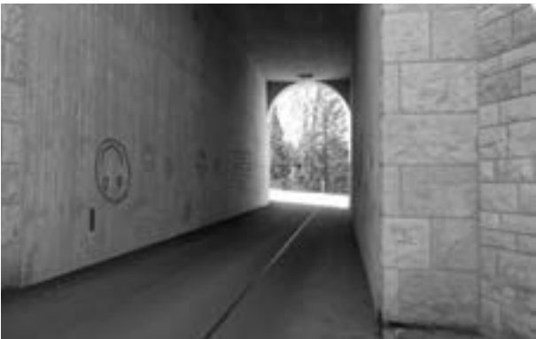
Fahrbahnerneuerung Weißiger Straße