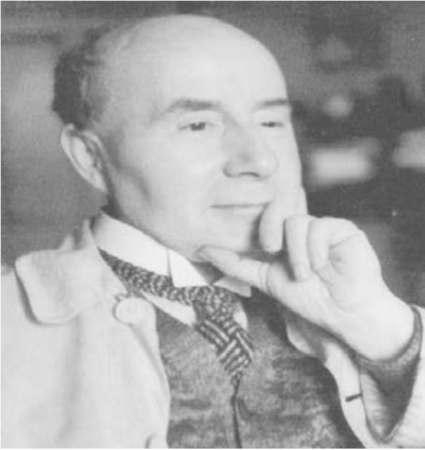
Quellen: Unterlagen Ortschronik, Sigrid Bøth: „Langebrück im Laufe der Zeit“