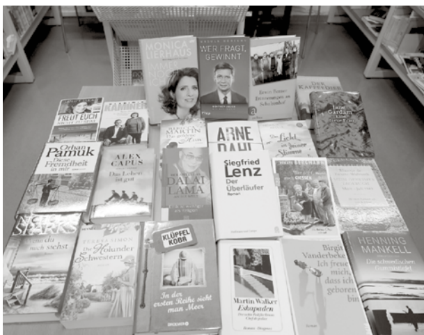
Auswahl der Bücher, die aus den Mitteln der Ortschaft 2016 in der Bibliothek angeschafft wurden.