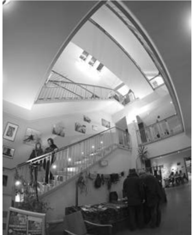
Blick ins Treppenhaus, Neuer Langebrücker Kunstmarkt 2016.

So titelte die Sächsische Zeitung ihren Artikel vom 24.10.2016 über den Neuen Kunstmarkt in Langebrück. Auch wir vom Organisationsteam waren mit der Vielfalt und Qualität der ausgestellten Kunst sehr zufrieden. Verschiedene Genres aus Kunst und Kunsthandwerk haben das Bürgerhaus bis unter das Dach ausgefüllt.